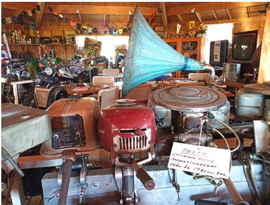
Holgers traktormuseum i Svartbyn, Överkalix.

Magasinet finns just nu på Norrtälje Turistbyrå och hos utvalda distributörer. Magasinets tema är "Klimatvänligt i Roslagen" och innehåller reportage om bland annat klimatvänliga äventyr och upplevelser längs kusten, spektakulära arenor, ett kreativt gårdsmejeri och historiska byggnader. Magasinet går att läsa online HÄR