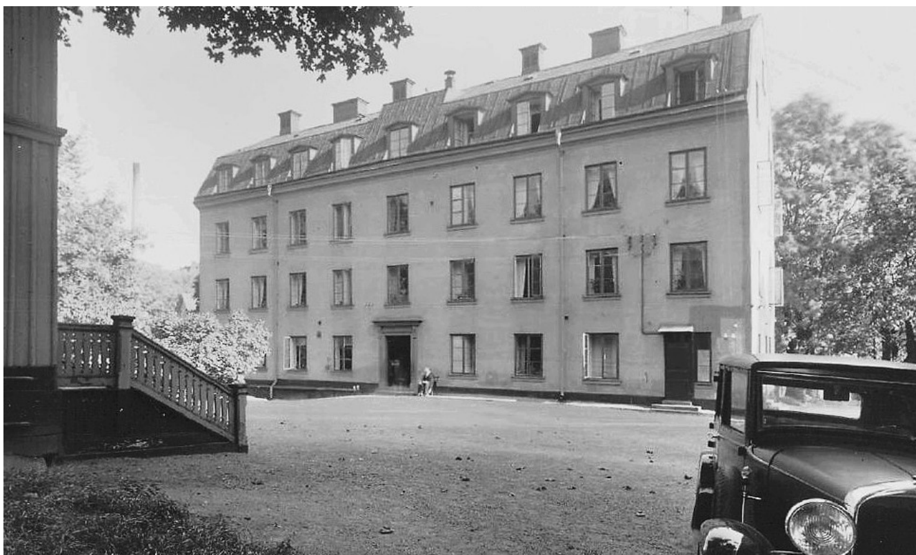
Klarahuset 1934 – då församlingshem för Klara församling. Byggt 1814 och vindsvåningen inredd 1866.

att överföra årets resultat 20 603 kronor i ny räkning