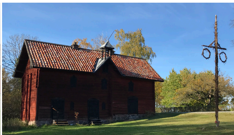
Fotografierna som illustrerar årets verksamhetsberättelse är exempel på aktiviteter och besök hos Lovö hembygdsförening, Sollentuna hembygdsförening, Järna hembygdsförening och Söderbykarls fornminnes- och hembygdsförening.