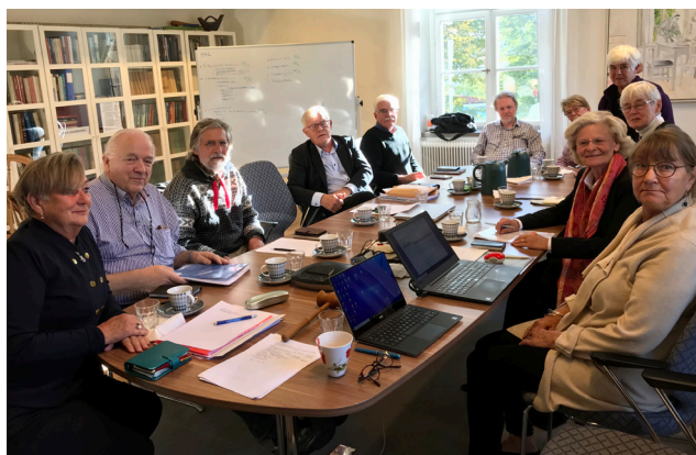
Delar av styrelsen

Förbundet nominerade Rimbo Hembygdsförening till rikstävlingen Årets hembygdsförening och boken Tyresö torp och gårdar utgiven av Tyresö Hembygdsförening till rikstävlingen Årets hembygdsbok. Förbundets eget kulturpris och hedersdiplom delades ut på årsmötet och på sidan 5 går det att läsa om pristagarna.