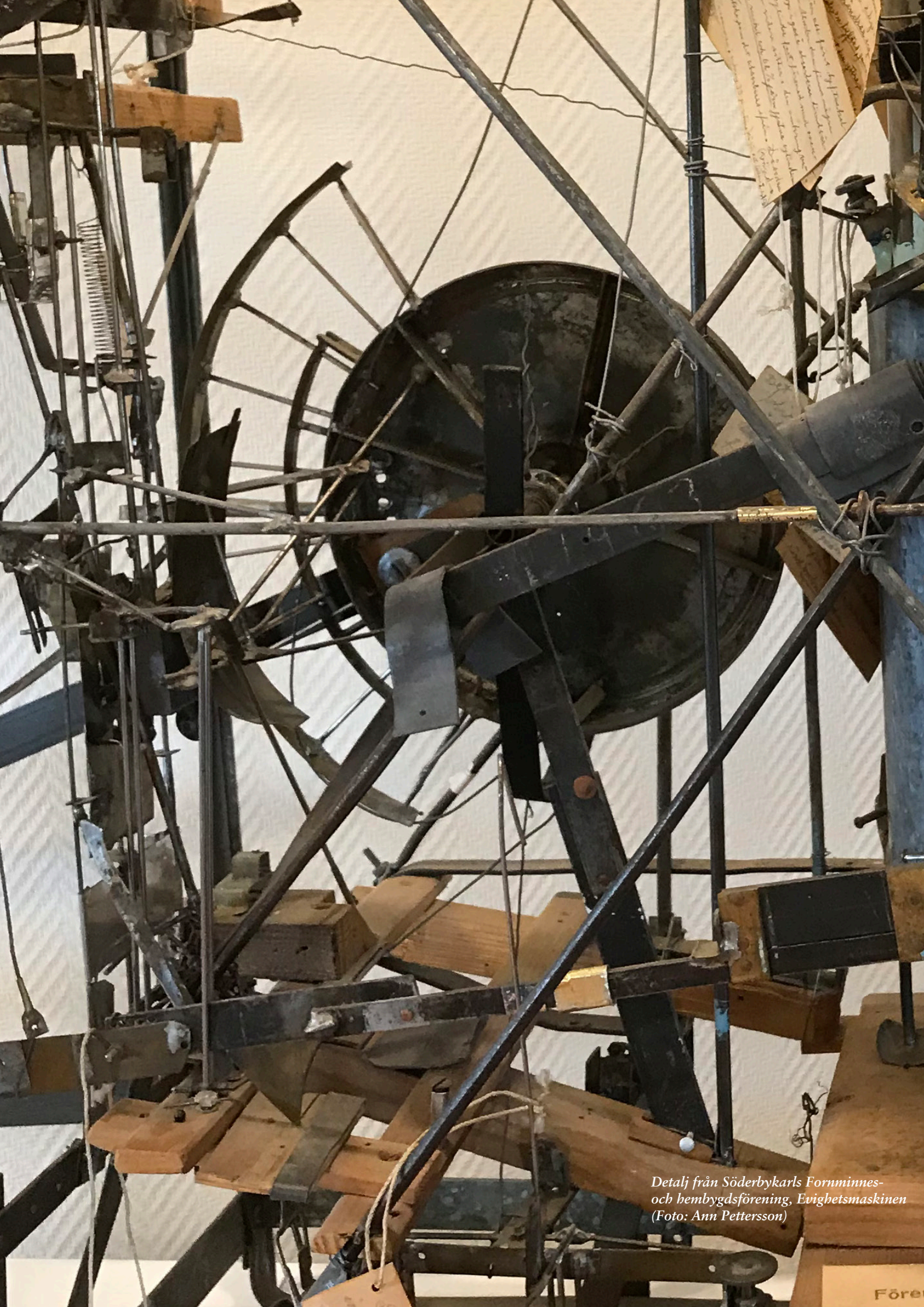
Detalj från Söderbykarls Fornminnes- och hembygdsförening, Evighetsmaskinen