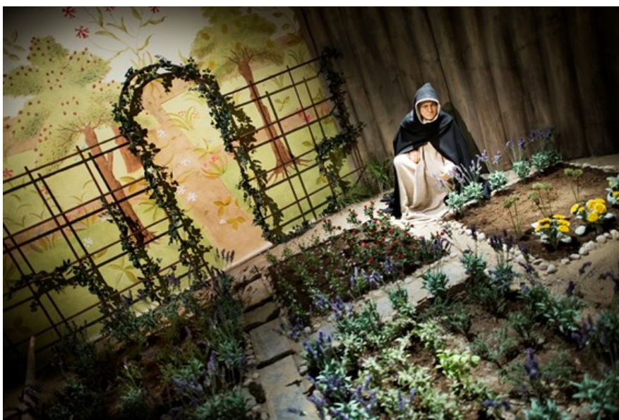
Medeltidsmuseet, Örtagården i utställningen.

Välkomna hälsar styrelsen i Stockholms läns hembygdsförbund!