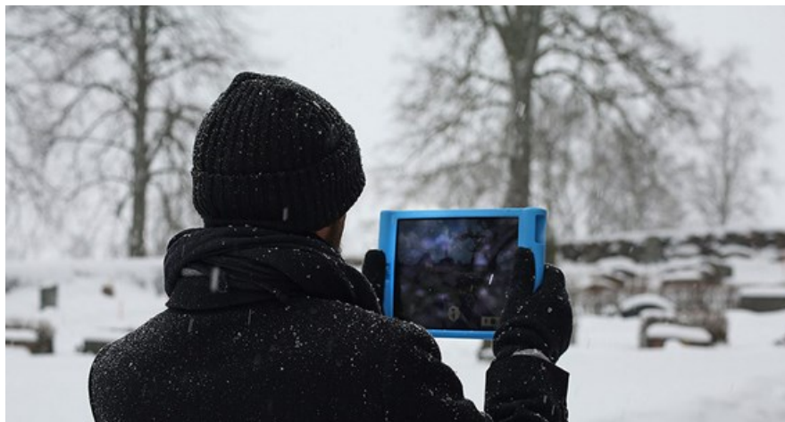
Guidning genom AR-app (s.k. augmented reality) i Gamla Uppsala.

begränsar vi deltagandet till två personer per förening. Läs mer om programmet och hur du anmäler dig HÄR