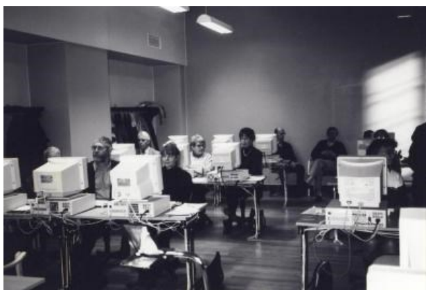
Datakurs för kassörer 1997, se_ab_hbf_00791 Creative Commons - Erkännande

Vår egen bildsamling publiceras nu i Kollektivt kulturarv. Med hjälp av Nina Hjulhammar digitaliseras och publiceras ett stort antal bilder från förbundets besök i länet och resor i landet. Tyvärr är texterna ibland lite knapphändiga så hjälp gärna till med mer uppgifter. Det är bara att fylla i formuläret vid bilden. Om du vill titta på bilderna så hitta du dem HÄR .