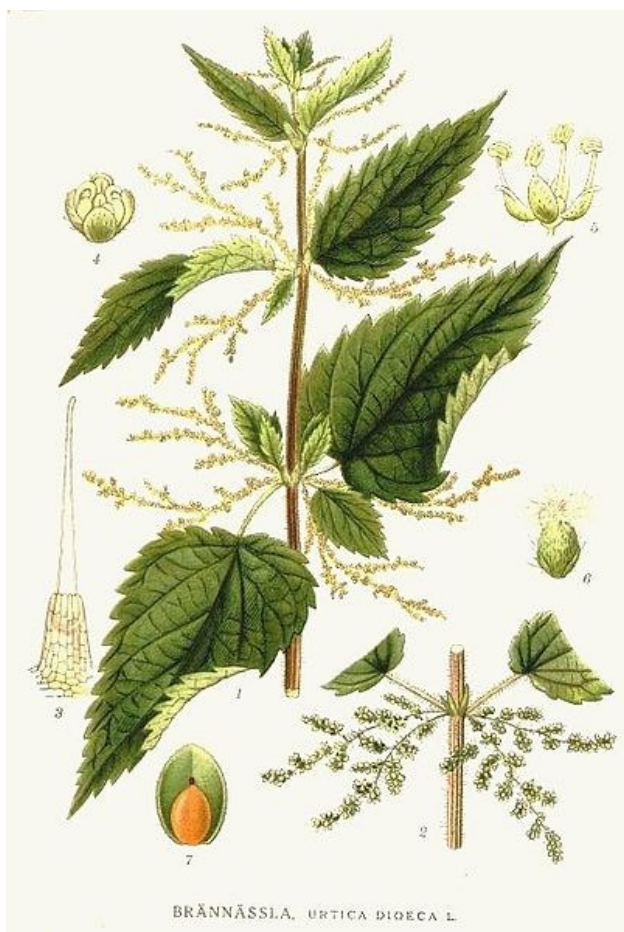
BRÄNNÄSSLA, URTICA DIOECA L.