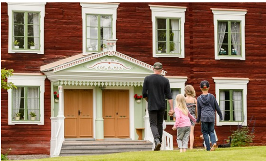
Kulturarvsdagen är Riksantikvarieämbetets årliga temadag som ska bidra till att skapa förståelse, intresse och engagemang för kulturarvet.

Det är dags att skicka in anmälan för årets temadagar för kulturarv och kulturhistoria, den 10–12 september. Riksantikvarieämbetet i samarbete med Sveriges Hembygdsförbund och Arbetsam, välkomnar alla som vill delta med arrangemang – att besöka på plats eller digitalt. Anmälan ska vara inne senast den 30 juni. Läs mer om dagen och hur du anmäler ert evenemang HÄR