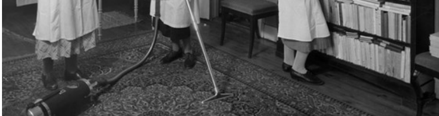
Städning - Fackskolan för huslig ekonomi, Uppsala. Upphovsman: Sundgren, Gunnar. Licens: CC-BY-NC-ND Källa: Upplandsmuseet