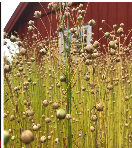
Det nya normala, styrelsemöte på Zoom + Linodling på Hersby, Sollentuna hembygdsförening