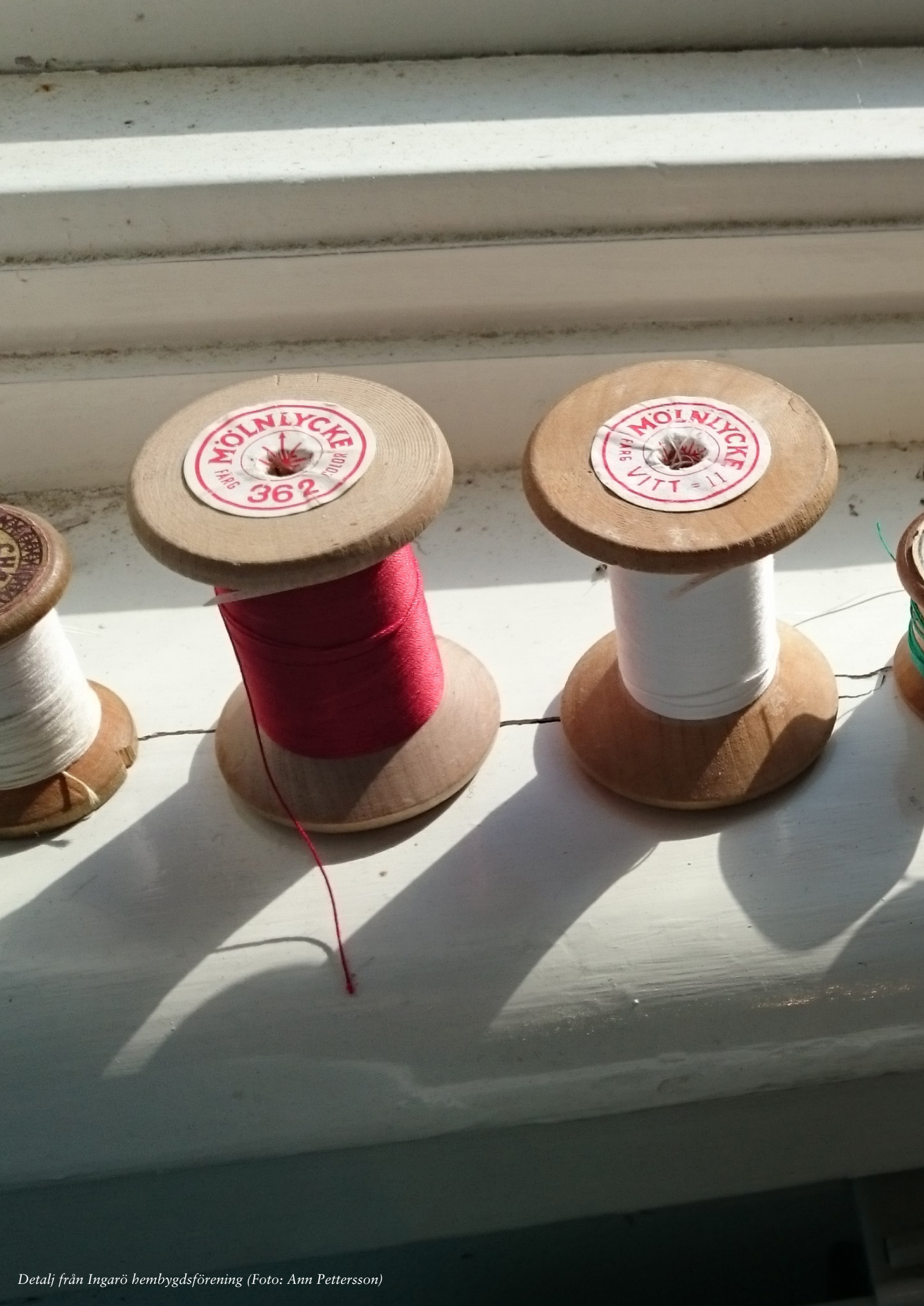
Detalj från Ingarö hembygdsförening