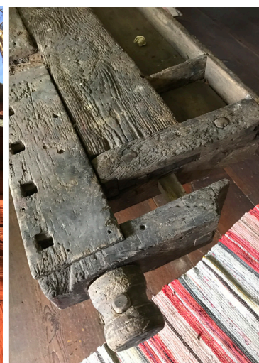
Hembygdsrörelsen rymmer det mesta!