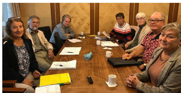
Delar av styrelsen