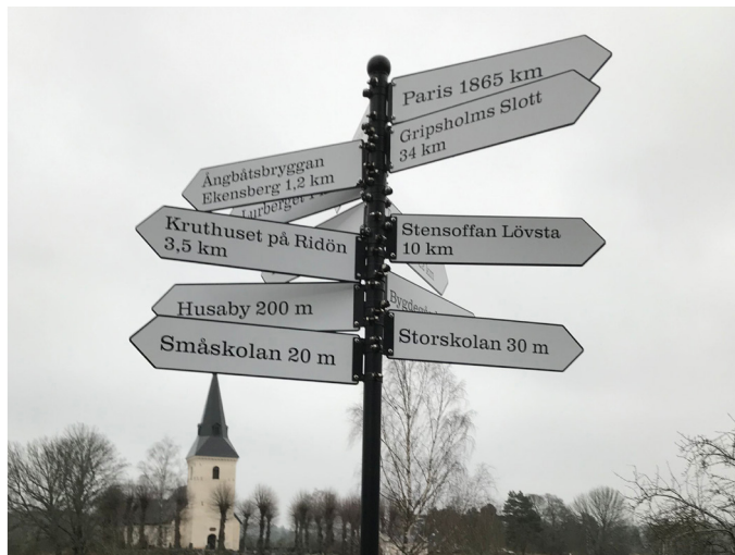
Wikipediaseminarium (sista fysiska träffen innan pandemin). På vift i länet, Enhörna, Huddinge och Salem