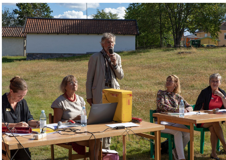
Årsmötet 2020 på Hersby, Sollentuna hembygdsförening