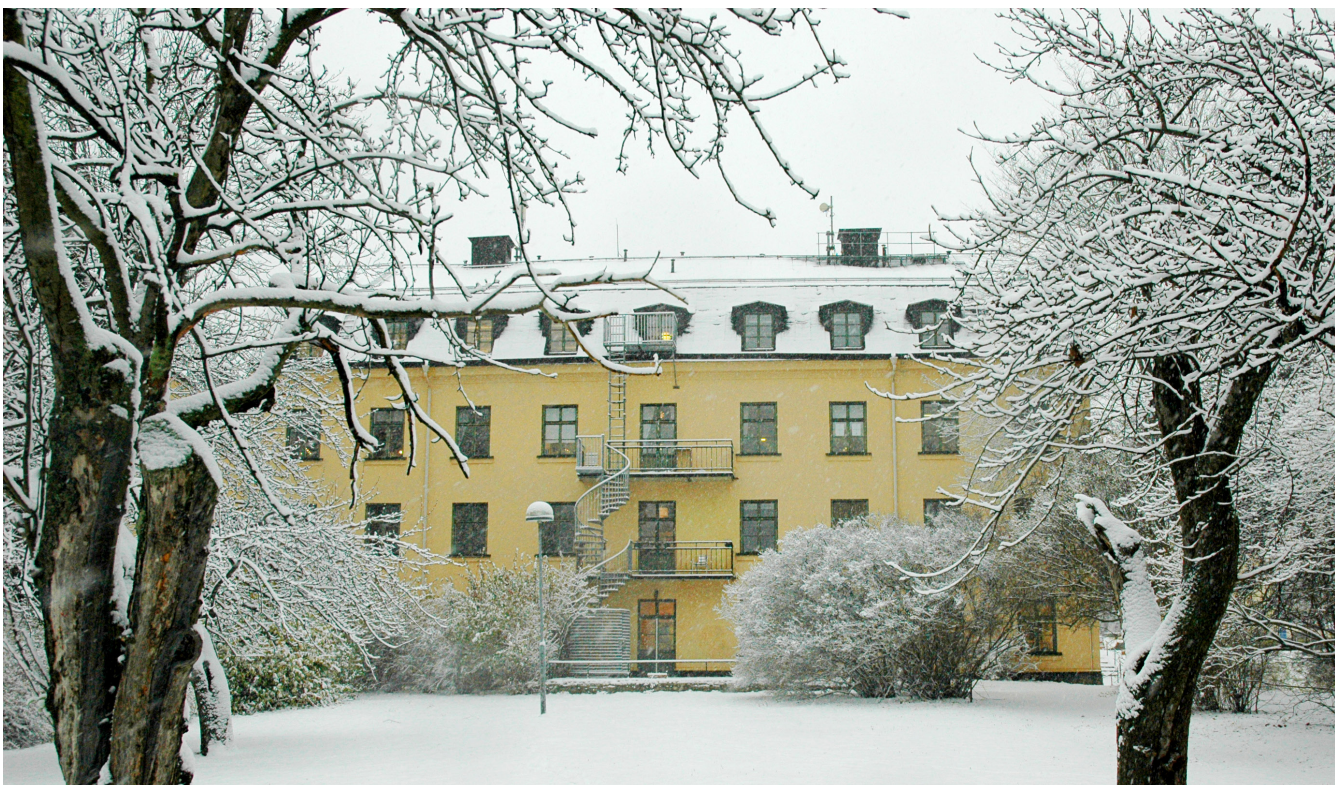
Klarahuset i vinterskrud (förbundets kansli huserar på vån 2)

att reservera årets resultat 274 279 kronor för coronastöd till medlemsföreningarna och projektet Kulturarvet som besöksmål