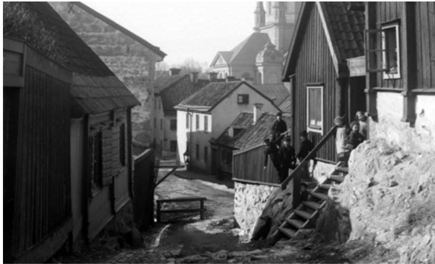
Stigbergsgatan västerut, i bakgrunden Katarina kyrka. Okänd fotograf, 1896

För vidare upplysningar kontakta Stadsmuseet: Fredrik Linder, stadsantikvarie, 08-508 317 79, fredrik.linder@stockholm.se