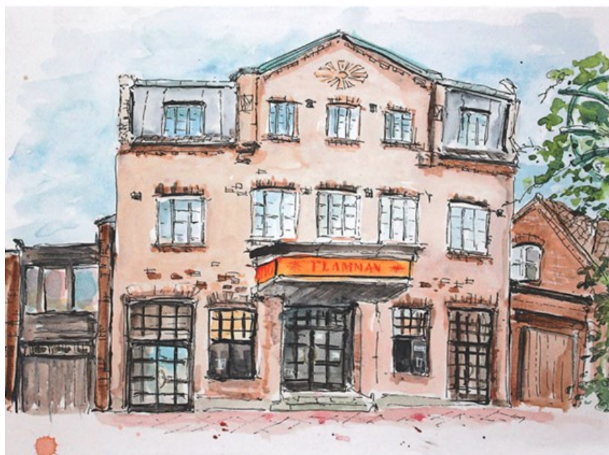
Förra årets vinnare av utmärkelsen Årets hembygdsbok blev föreningen Svedala-Barabygdens årsbok

Inspirationsträffarna är gratis och självklart bjuds det på fika!