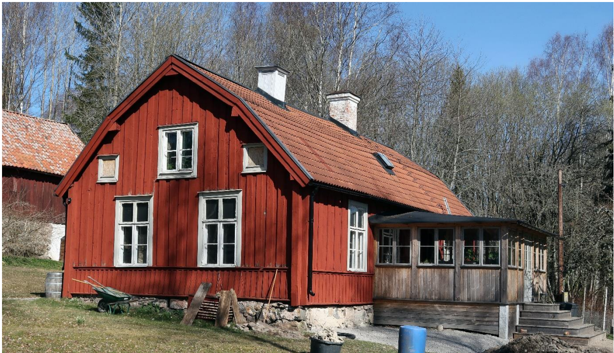
Jenningska skolan 2023.