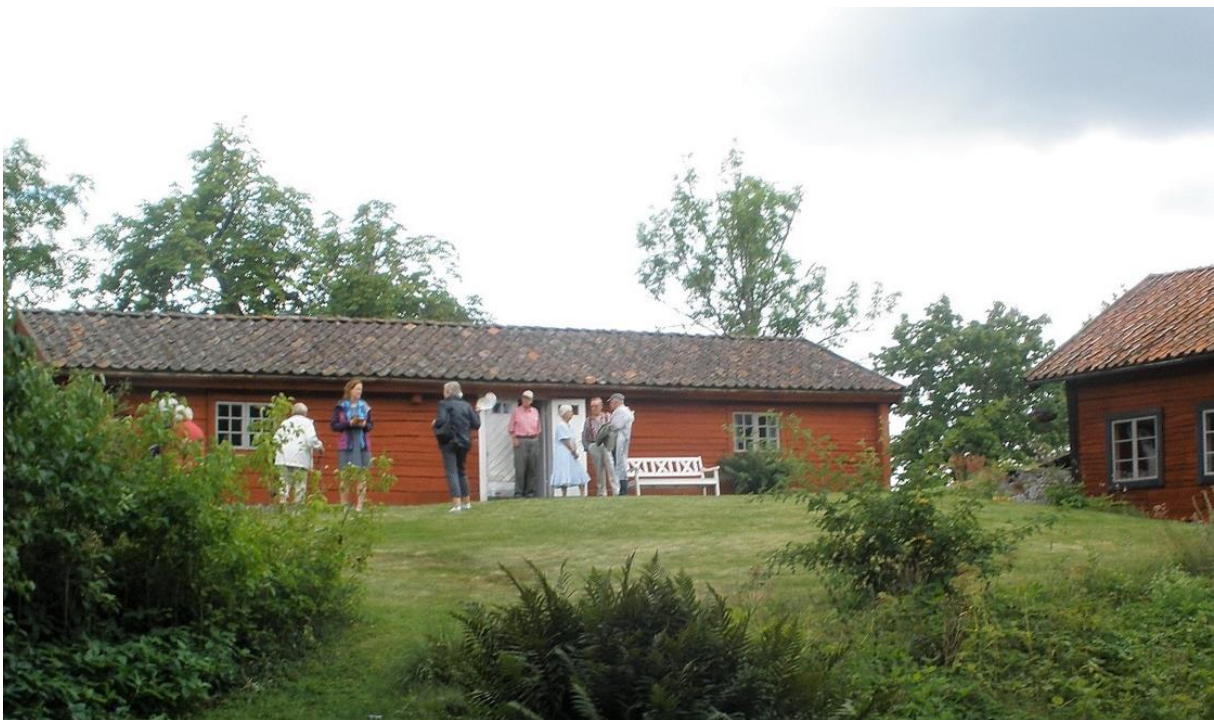
Skalmeja bostaden Tiggesta.

Det har bott en sådan vid Tiggesta gård, i den fantastiskt fina parstugan som var huvudbyggnad på gården för ganska länge sedan. Då var Tiggesta militärt boställe för en skalmejablåsare. För blåsa skalmeja det gjorde man bland annat i det militära, och man kan väl förmoda att Tiggestabonden stått framför trupperna och blåst i sin skalmeja till soldaternas glädje och för att ingjuta mod inför ett fältslag. Skalmejan är ett äldre träblåsinstrument som användes förutom i det militära även till danser på logar och bryggor. När bonden vid Tiggesta trakterade sitt instrument vet jag inte men om Du som läser detta vet något så låt oss veta det. Parstugan ligger så fint uppe på berget med en brant sluttning ner till Yngaren. Utvändigt ser stugan ut som en parstuga skall göra det vill säga lång och låg med små fönster och med dörren mitt på framsidan. Nu är det kopplade fönster med små glasrutor men i originalet hade varje fönsterluft två glas. Går man in i den kan man se flera förändringar som gjorts under årens lopp för att göra den användbar för nutida bruk. Skalmejablåsaren hade säkert inte en spispanna för centralvärme installerad i svalrummet mitt i huset eller vatten i kran. VC visste han och hans familj inte vad det var.