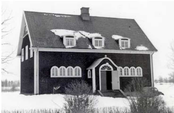
Mjältnäs skola 1951

Den bilen fick enligt Bengt göra nytta på annat sätt också. Man hissade upp bilen på en ställning och lät bakhjulen snurra mot stora hjul på en axel med en remskiva som gav kraft och rotation till en kapsåg till exempel. Hastigheten på sågen kunde regleras med att man lät bilen gå på hel eller halvfartsväxel, och man kunde också ge mer eller mindre med gas. En genialisk idé men om den skulle klara arbetsmiljökraven idag är väl knappast troligt.