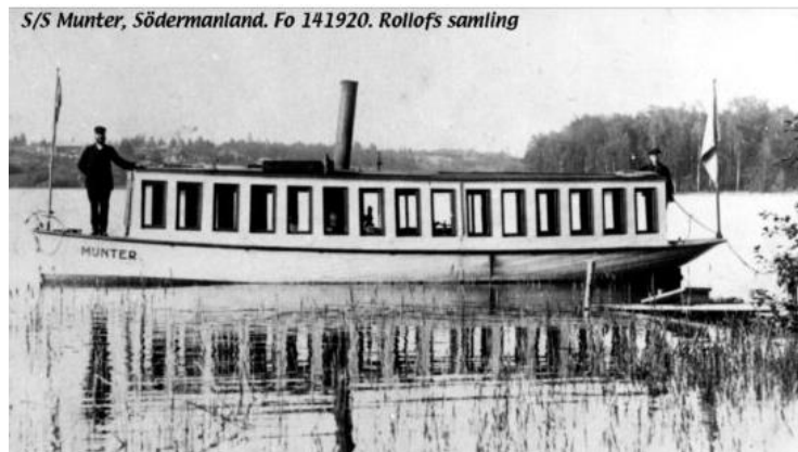
S/S Munter, Södermanland.