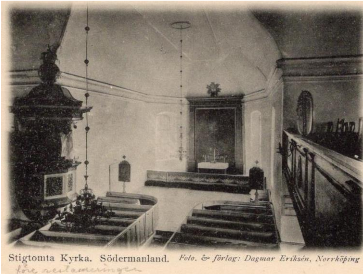
Stigtomta kyrka före 1904

En imponerande högtidlighet ägde rum i Stigtomta kyrka söndagen den 14 september med anledning av den nya arfs-lagens promulgation. Efter avslutad högmässogudstjänst där kyrkoherden i Västra Vingåker, hr. J P Wålin predikade avsångs av åtskilliga amatörer en kantat där solopartierna och duetten framfördes av de berömda sångarna, herrar Strandberg och Wallin. Kantatens första strof lyder: