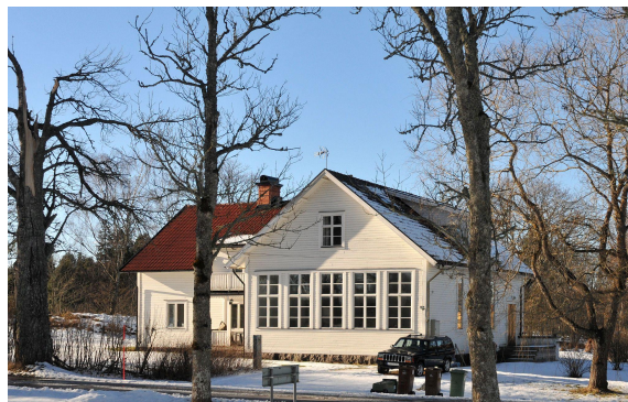
Bärbo nya kyrkskola 2016.

Bärbo kyrkskola byggdes 1914 och användes för skolverksamhet till 1969 och ersatte den gamla kyrkskolan som var belägen i nuvarande Bärbogården.