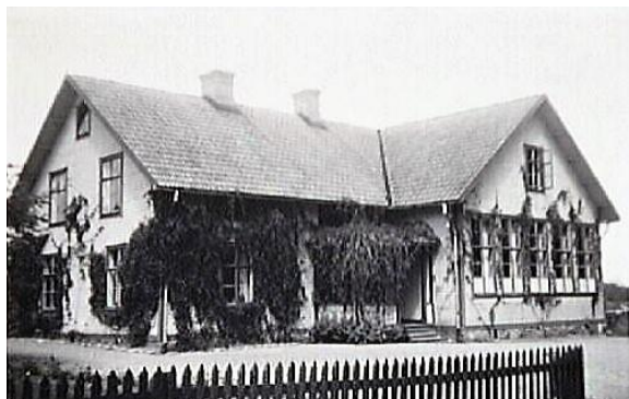
Bärbo nya kyrkskola 1925.