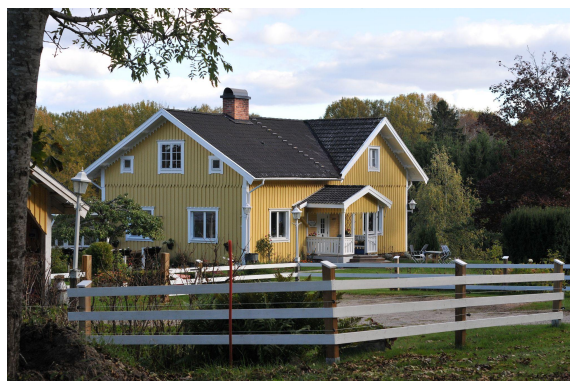
Oxhagen (Nääs småskola) 2022.