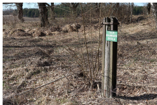
Av Täckhammars skola finns bara flaggstångsfundamentet kvar.

Skolan donerades 1888 av dåvarande ägaren till Täckhammar, David Böklin, och ersatte Jenningska skolan.