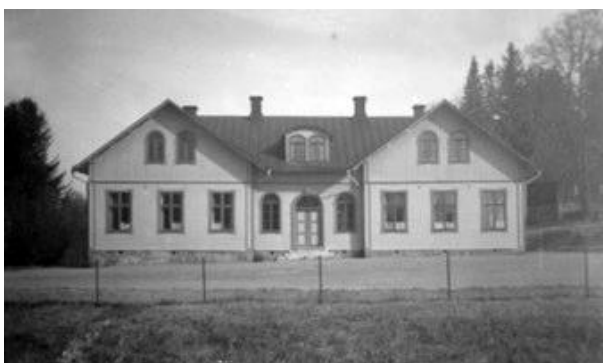
Täckhammars skola cirka 1925.