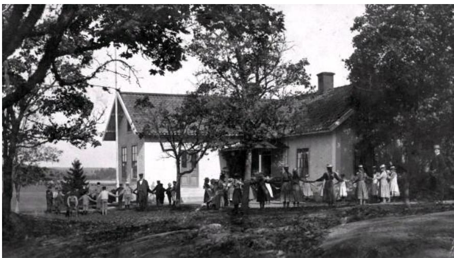
Bärbo kyrkskola 1905.