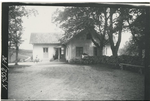
Bärbo gamla kyrkskola 1925.