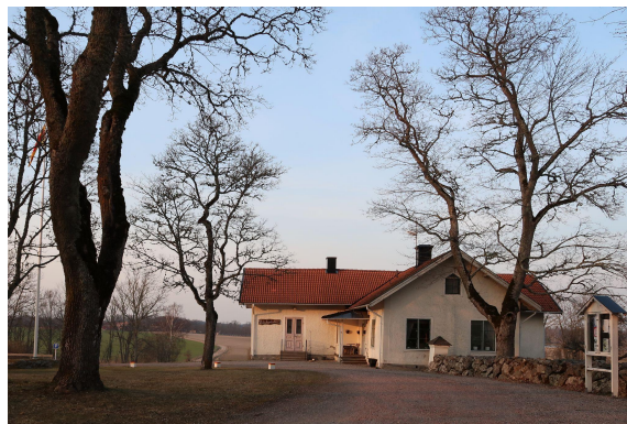
Bärbogården 2019.

Bärbo gamla kyrkskola – nuvarande Bärbogården – ligger alldeles bredvid kyrkan och med en vidsträckt utsikt över Nääs och sjön Långhalsen. De äldre generationerna av läsarna minns säkert festerna och andra begivenheter, som traktens olika föreningar anordnade där. Idag är Bärbogården församlingshem i Svenska kyrkan.