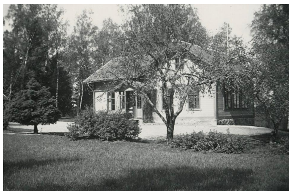
Nääs småskola 1925.