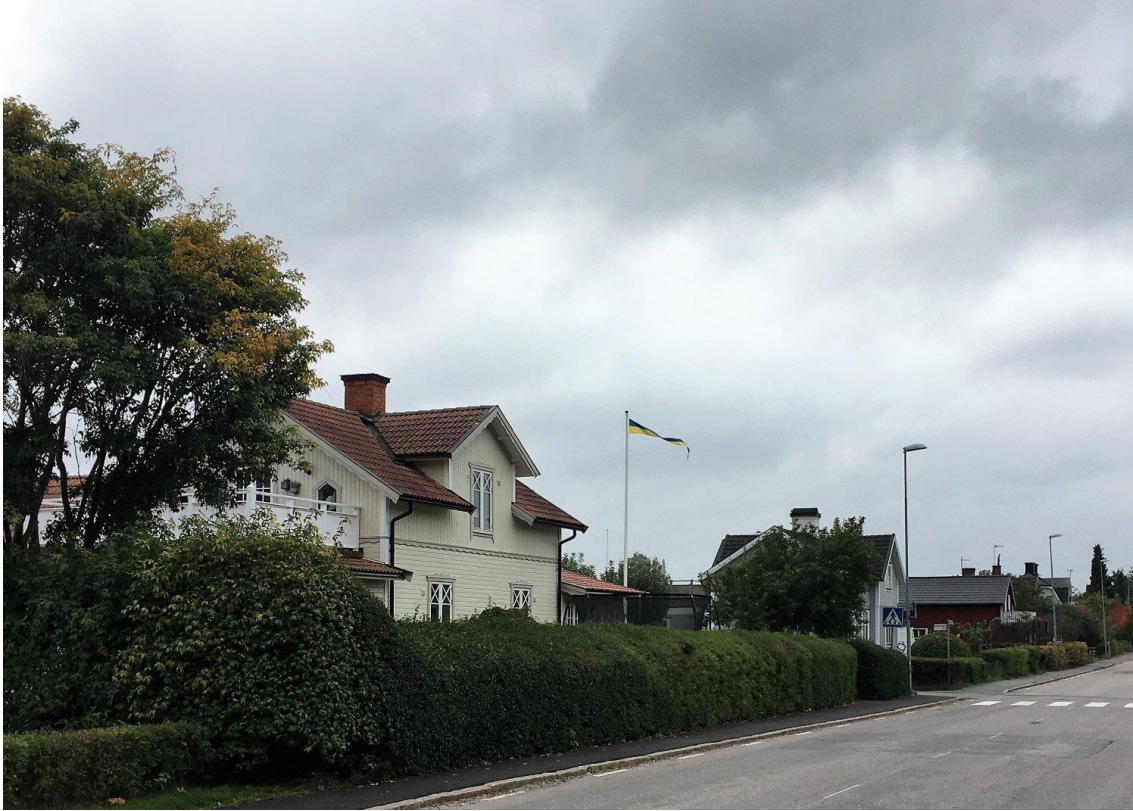
Bärbovägen 18 Sofieberg