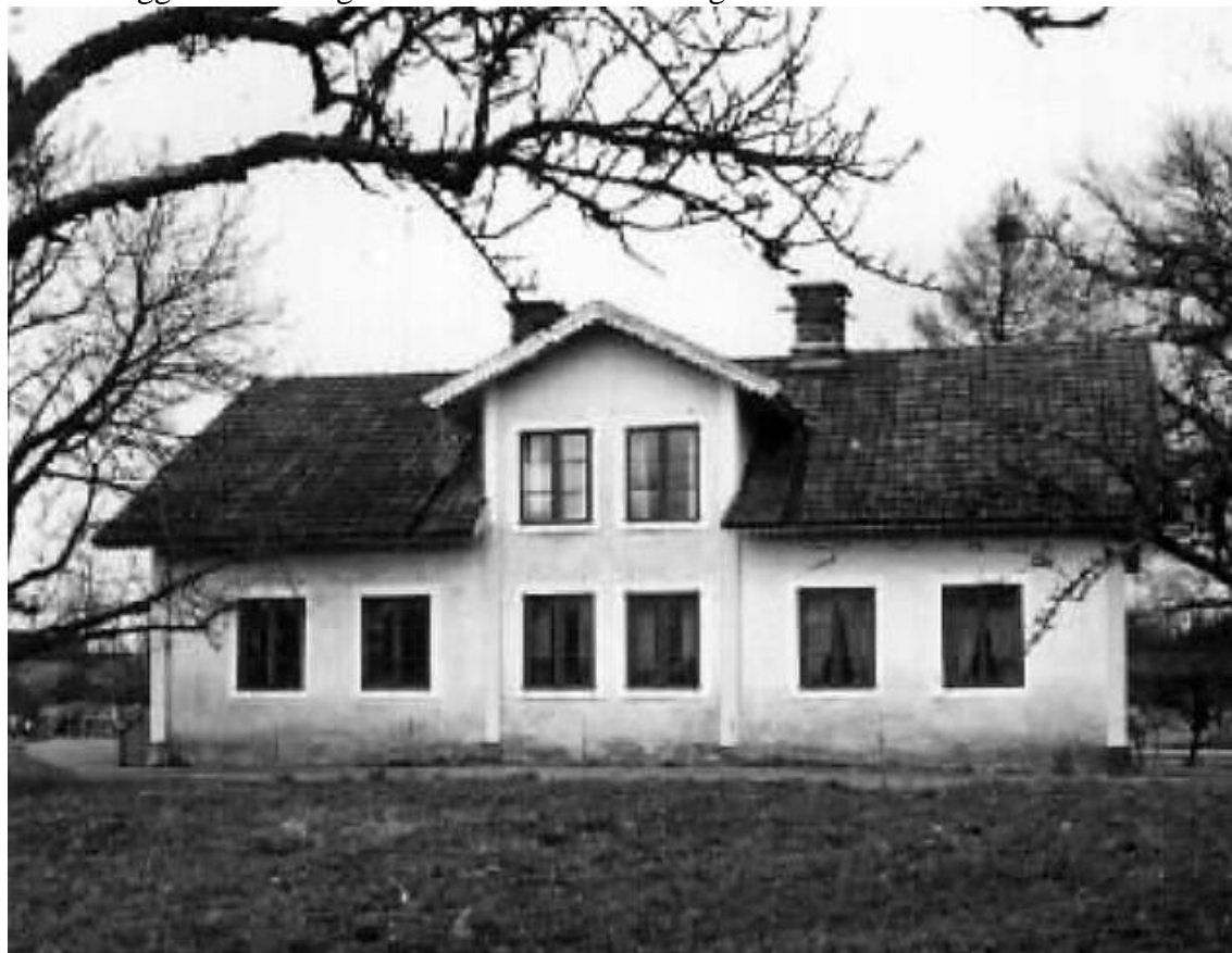
Tengsta, manbyggnad uppförd 1800 och moderniserad 1944. Foto: Dan Samuelsson 1947

Gården ligger utmed väg 52 ca 1 km väster om Stigtomta