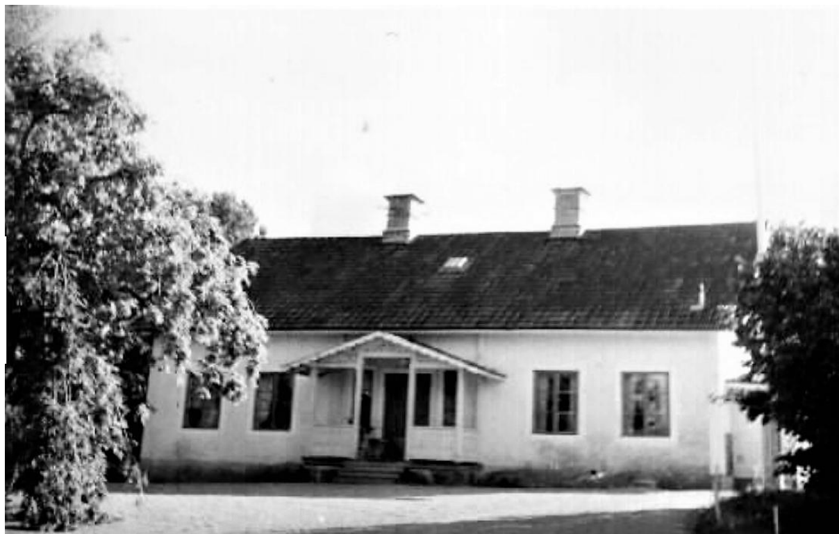
Tengsta, framsidan.