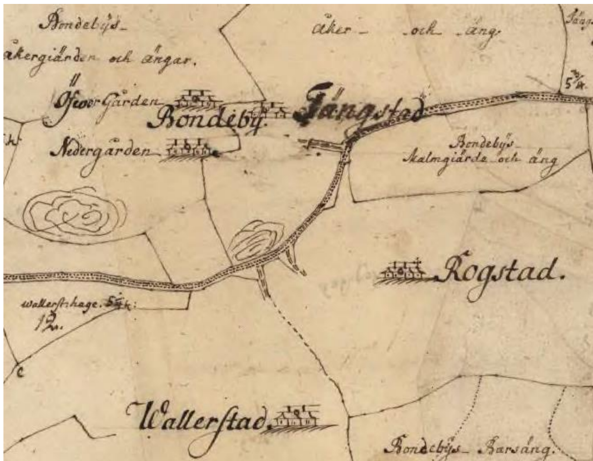
Klicka gärna Karta ca 1750 så får ni upp en större karta på Lantmäteriets hemsida.