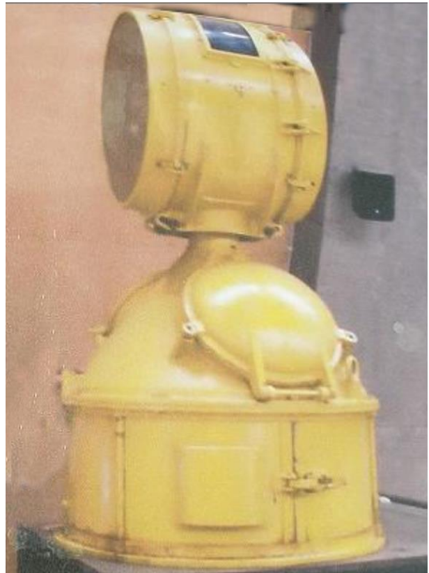
Goglunda flygfyr och en närbild på lampan hämtad från Lid