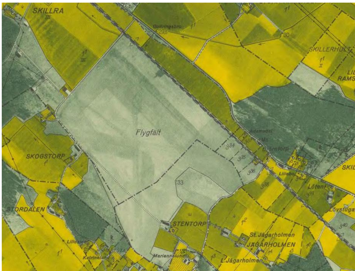
Ekonomisk karta från 1958.

Den första etappen av fältet var emellan vägarna som finns idag.