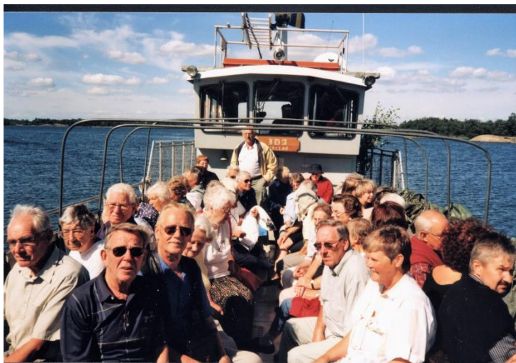
Sankt Anna Skärgård 2001