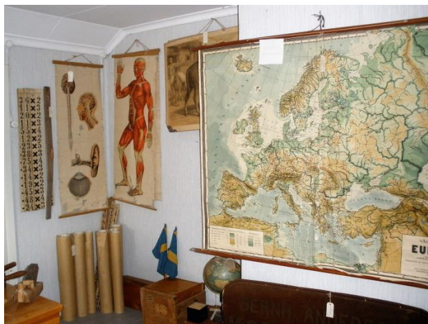
Delar av skolmaterialet i vårt museum