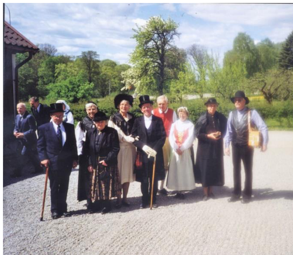
Gammaldags gudstjänst 1998