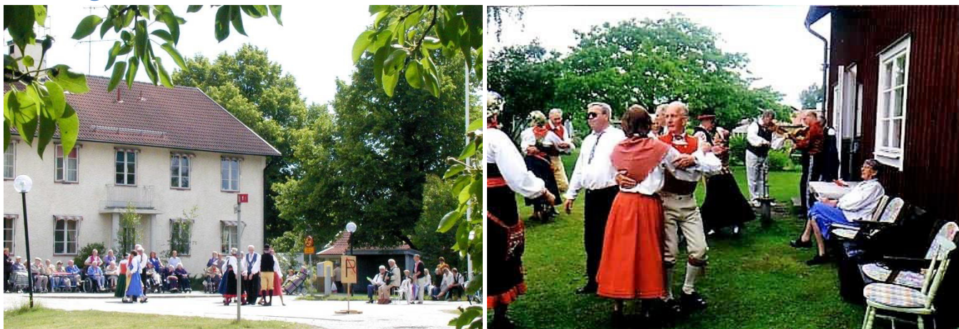
Vid Parkudden en midsommar