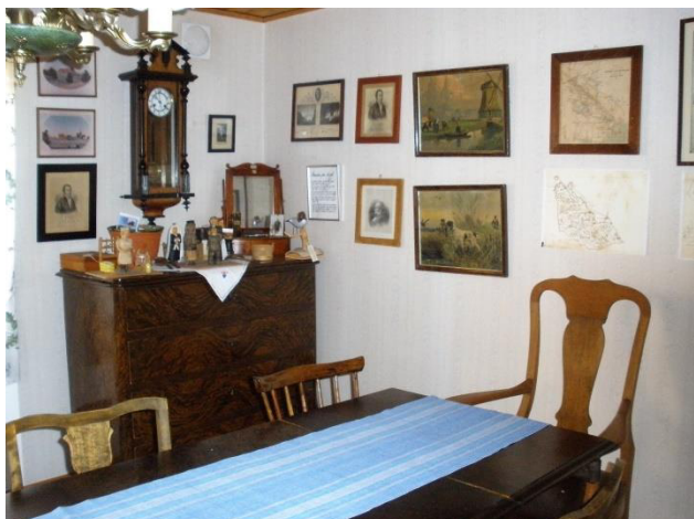
Ett av de gamla rummen, nu styrelsens rum