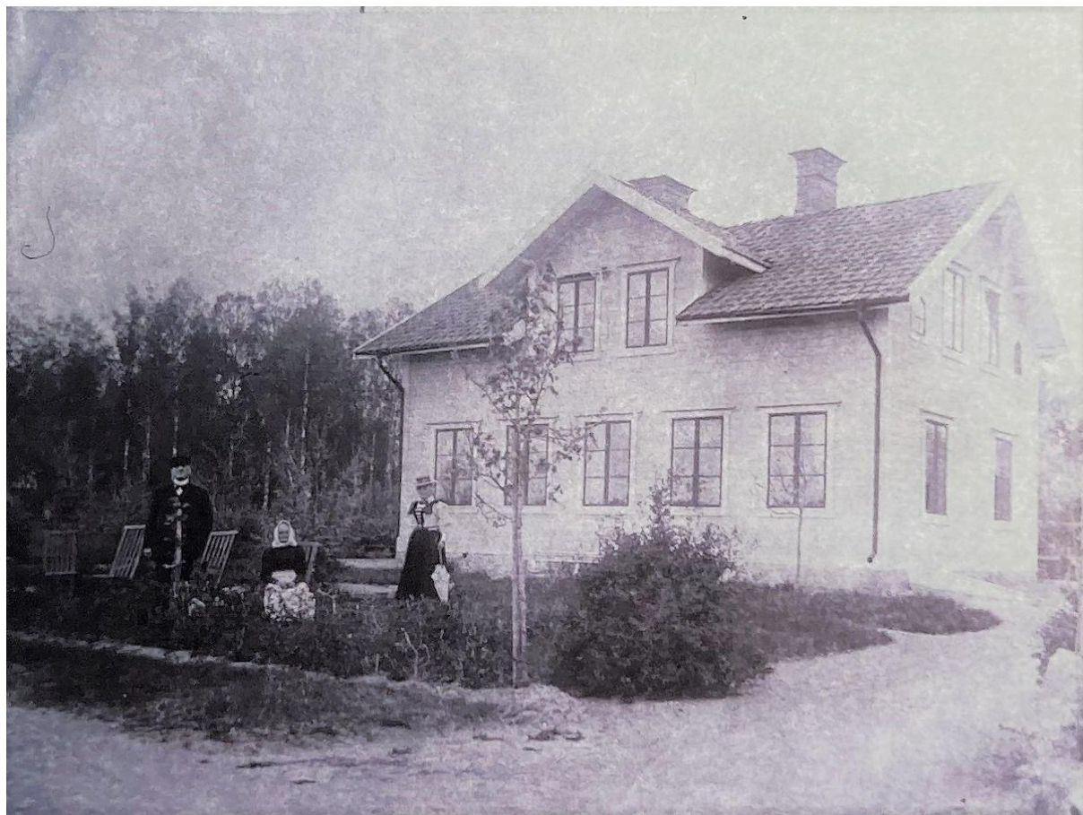
Uddbol 2 Tryggs hus. Byggår: ca 1889