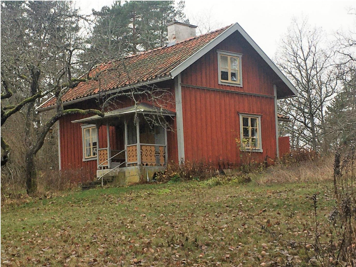
Vi vände vid Fjällstugan som ska ha varit den första skolan vid Århammar. Nu byggs huset ut, det görs varsamt för att bevara känslan i det gamla huset. Foto Mikael Wingren 2020