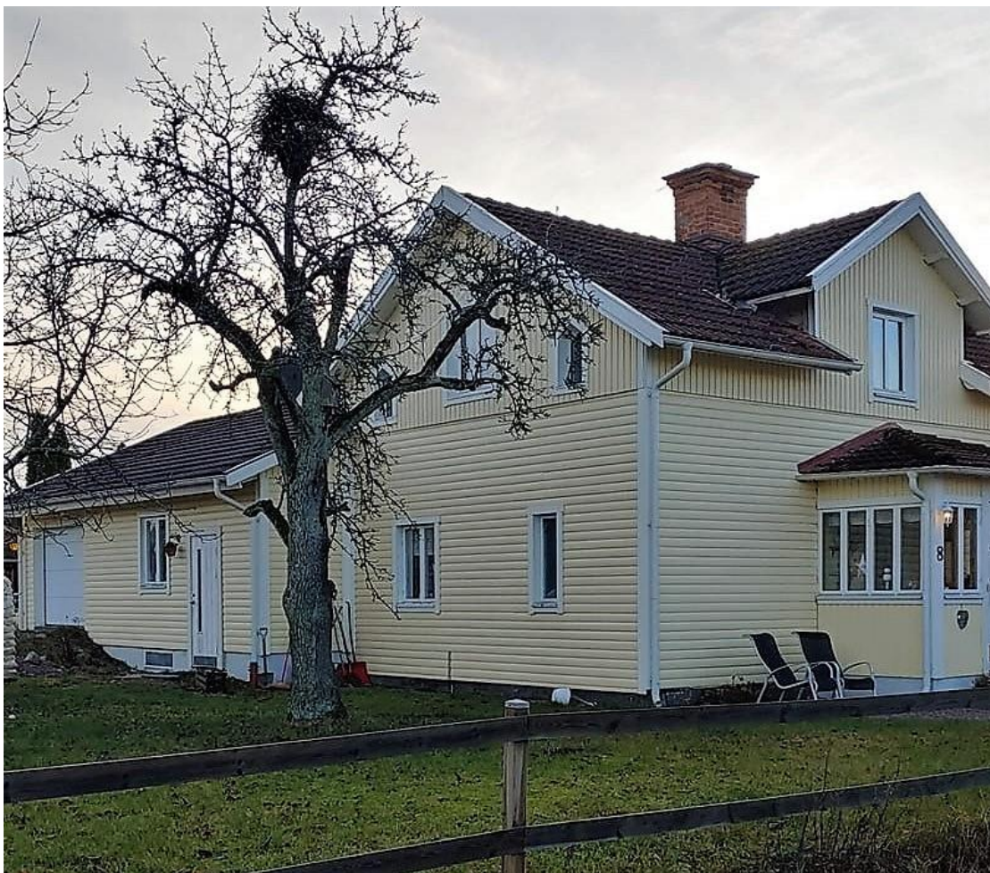
Haga Bärbovägen 8, foto Jörgen Sörberg

Vi köpte huset 1997 av Leif och Dagny Nyström. De byggde till huset med en markplan och källardel i slutet på 1970-talet.