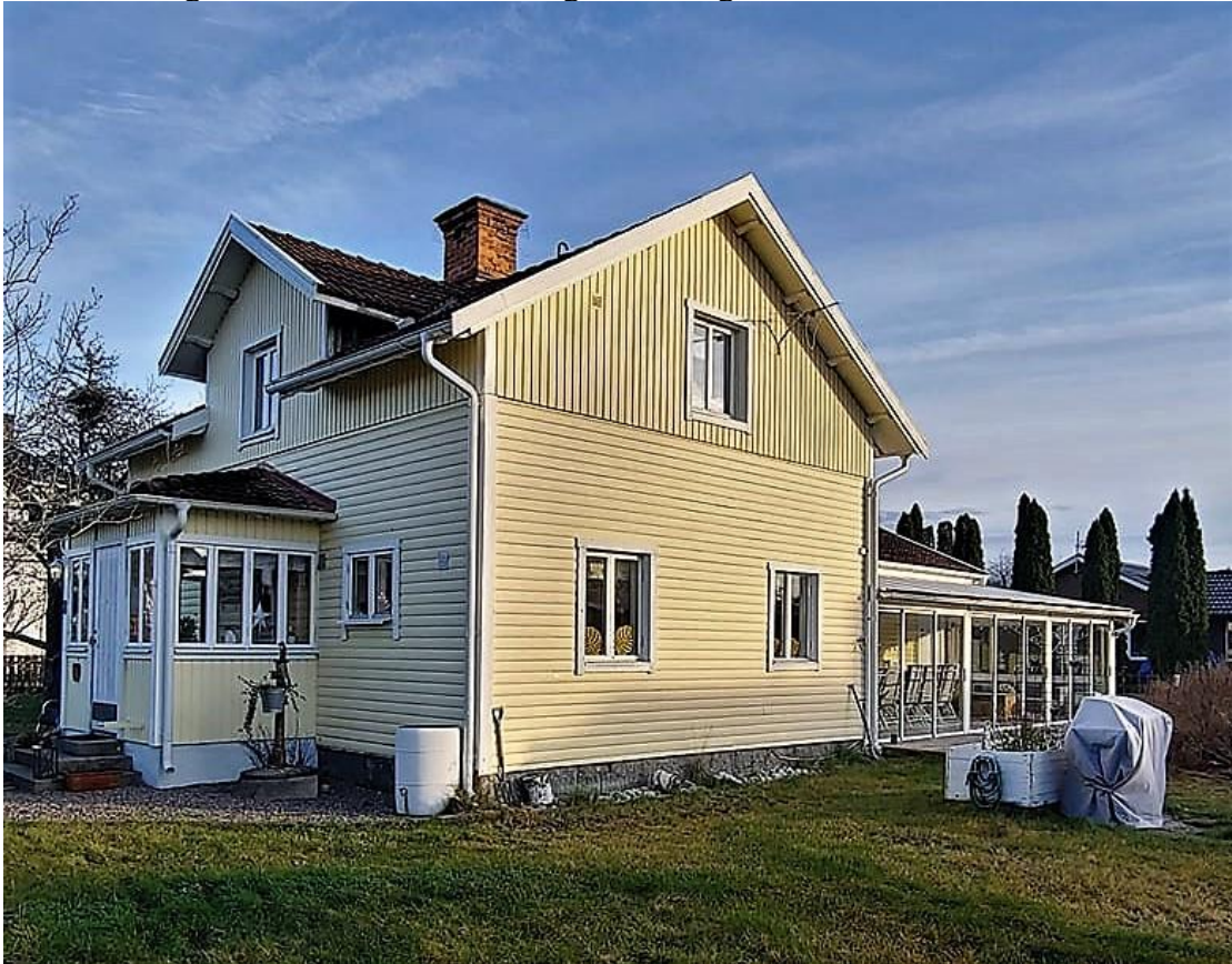
Haga Bärbovägen 8

Byggår ca 1909 Fastighet: Bondeby 1:44 med namn Haga nr 1 Nuvarande ägare Sara Forsman och Jörgen Sörberg