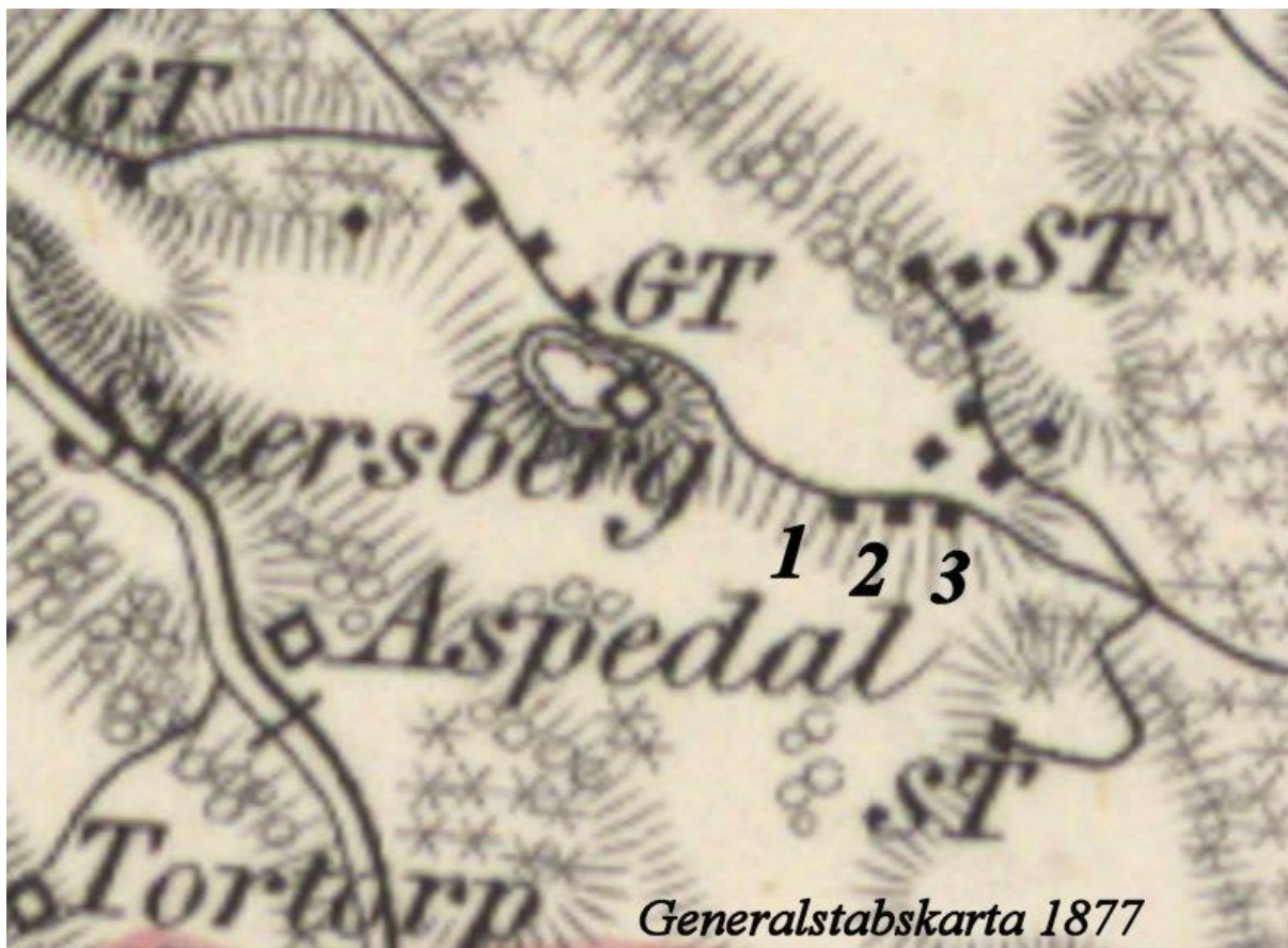
Karta 2. Generalstabskarta från ca 1877 Nr 1, 2 och 3 är troliga placeringar för Höglunda, Kristinelund och Johannisberg. Ordningsföljden vet vi dock inte!

För att fastslå ovanstående placering på karta 2 har jag använt fakta för vilken tid dessa torp funnits på Ängsäters mark: Gustafslund 1826 - 1865, Johannisberg 1823 - 1890, Kristinelund 1840 - 1890 och Höglunda 1831 - 1935. Av dateringarna från kyrkböcker och att karta 2 visar situationen ca 1877 kan vi med stor sannolikhet anta att torpen markerade med 1, 2 och 3 är Höglunda, Kristinelund och Johannisberg, Gustafslund fanns inte kvar 1877.