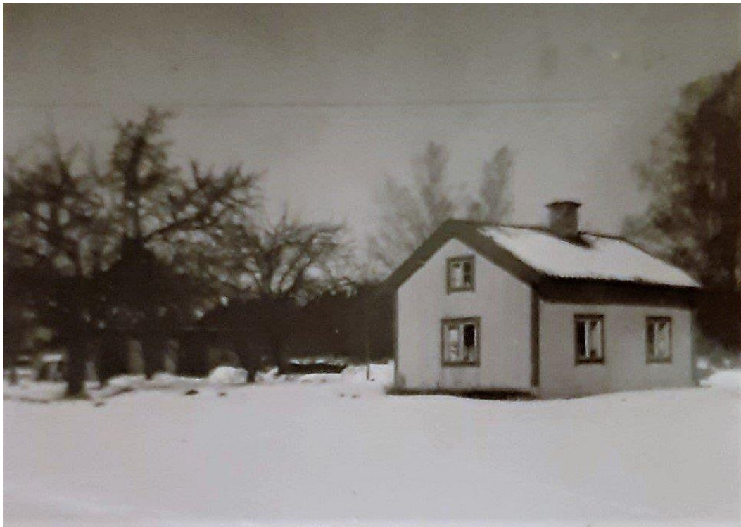
Den gamla stugan fotograferad vid Nykyrkavägen omkring 1960