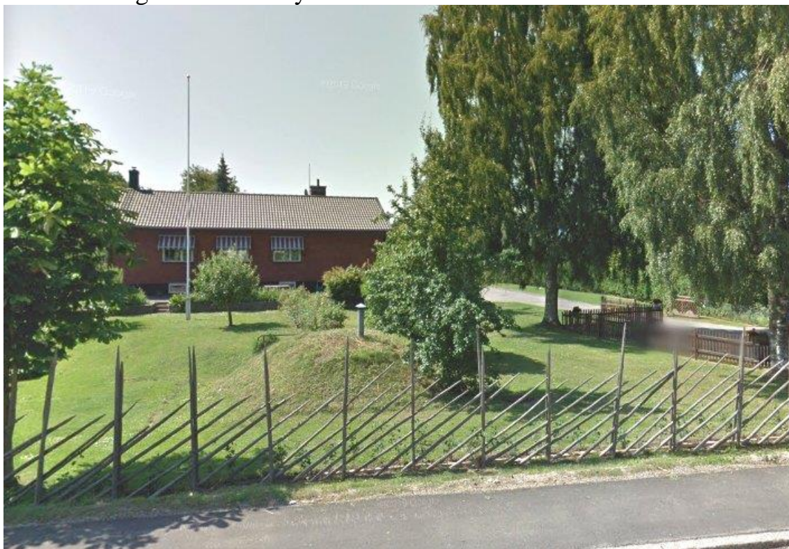
Fjällstugan som den ser ut idag. Huset byggdes 1967.