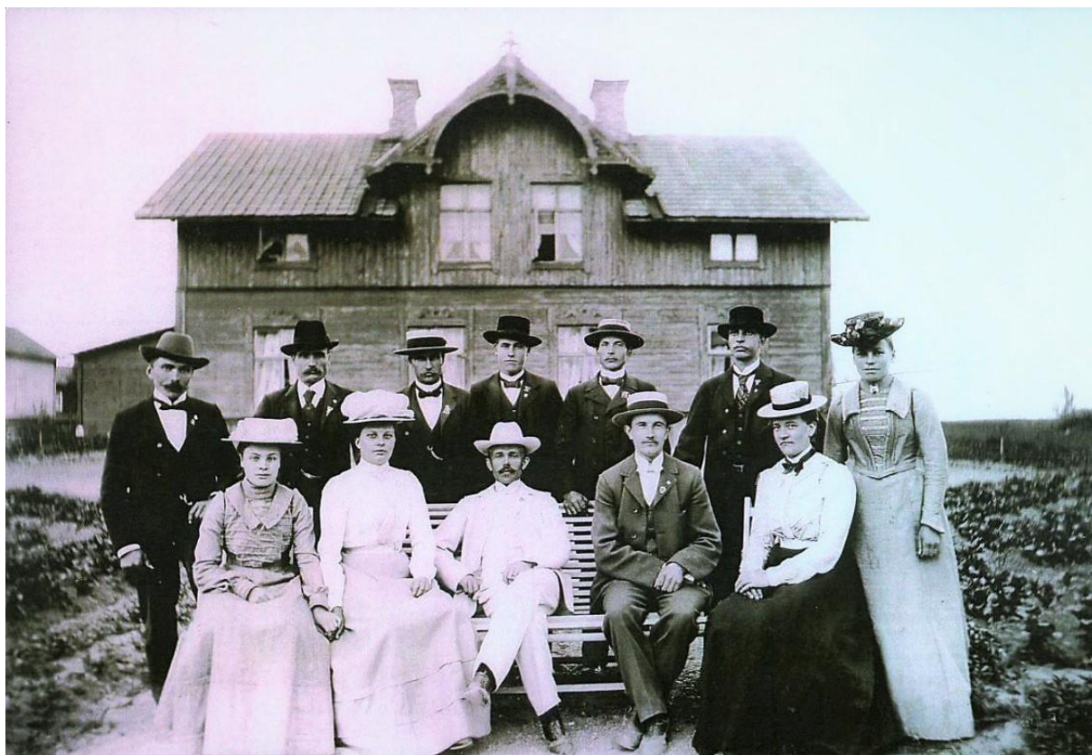
Foto 1903, troligen vid ett möte med logen NTO i Stigtomta vid Emiliero.