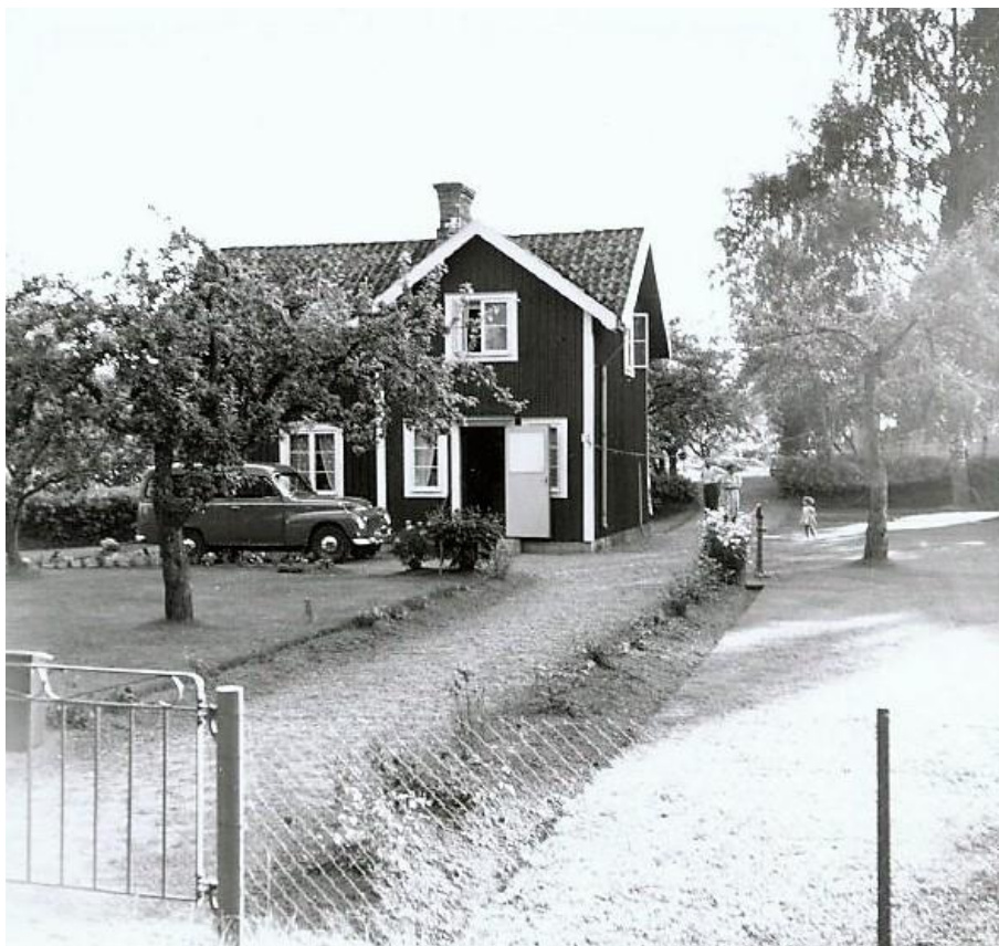
På bilden från 1961 ser man huset innan tillbyggnad.