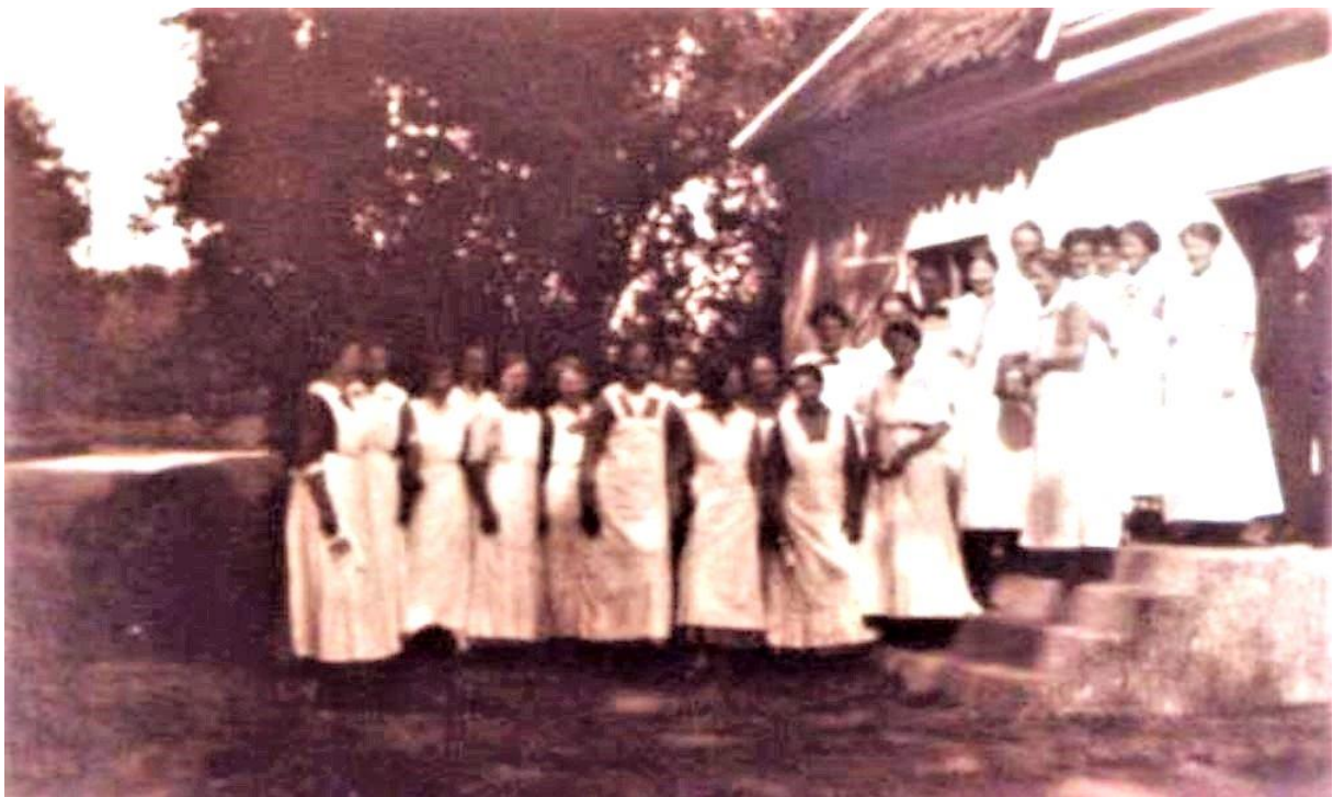
Denna bild visar en Konserveringskurs som hölls vid Oxelgården.

Avskrift från samhällsvandringen 2011 /Mikael Wingren 2020