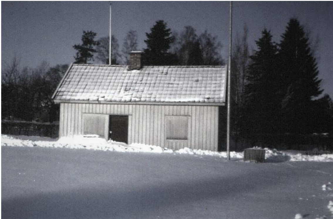
Den gamla tvättstugan vid Tryggs väg, troligen densamma som fanns vid ovan nämnda sjö.