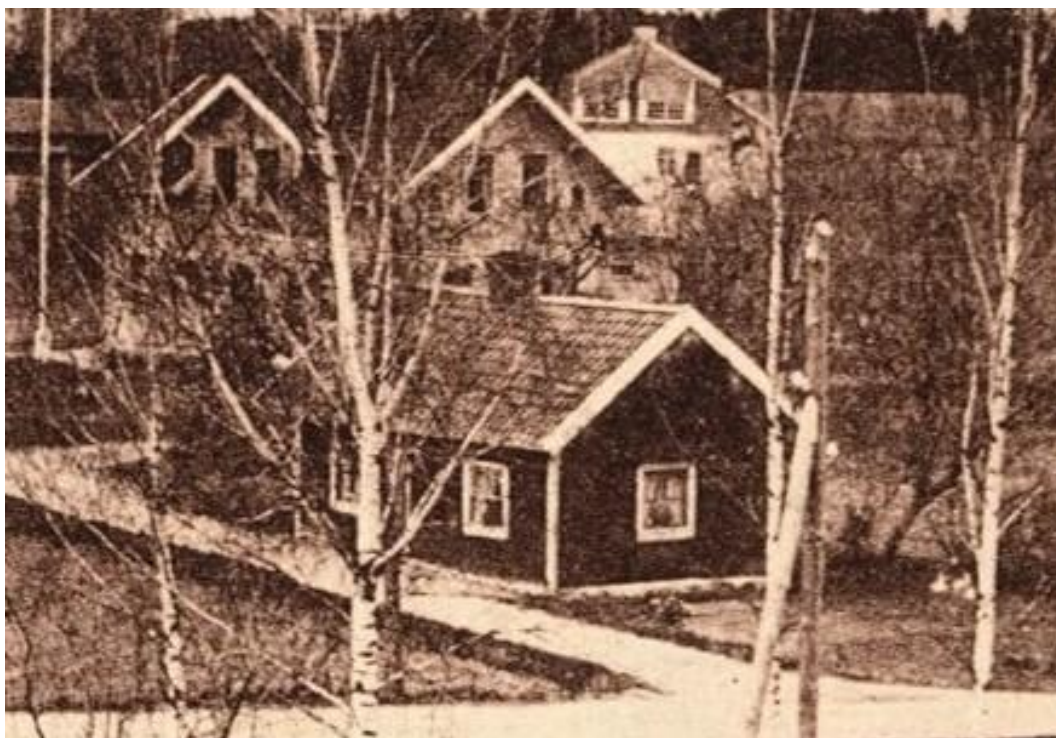
Del av bilden ovan

Stigtomtabyen bestod på 1800-talet mest av skog men efter Vrenavägen i höjd med nuvarande ålderdomshemmet fanns på västra sidan av vägen hur underligt det än låter en mindre sjö med klappbrygga och allmän tvättstuga. Hit förde traktens folk sin tvätt. Tvättstugan inrymde dels ett bostadsrum, dels tvättstuga. Huset var nog mycket gammalt. Byggt med lera i väggarna. Sjön dikades ut i början av 1900-talet i samband med vägarbeten och tvättstugan försvann i början av 1960-talet i samband med brandövning.