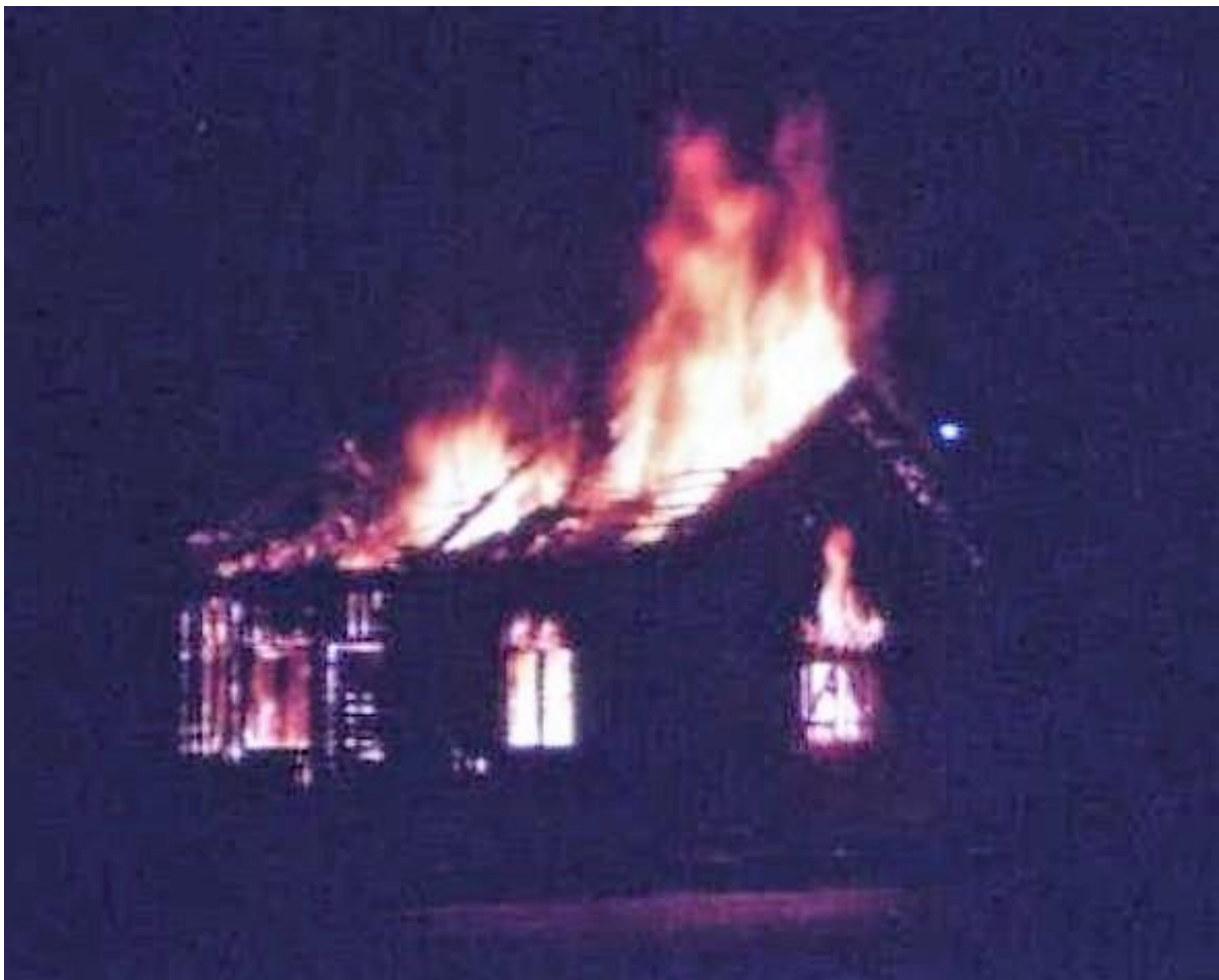
Tvättstugan bränns ned i övnings syfte av brandkåren ca 1960-63.

Avskrift från samhällsvandringen 2011 med smärre justeringar/Mikael Wingren 2021