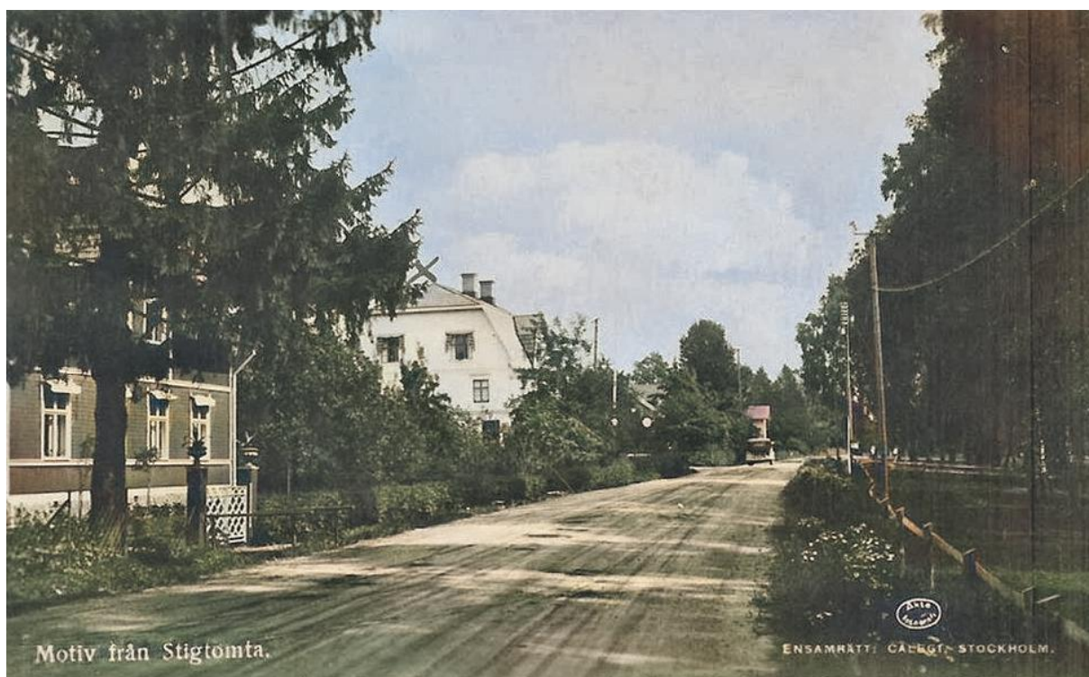
Hallavägen 12 är första huset till vänster och längre fram ligger Nyborg "Berggrenshuset" Foto ca 1940.