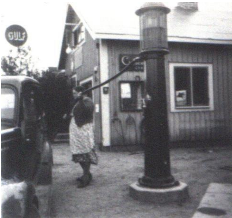
Bensinförsäljning på 1950-talet cykelverkstaden låg där pizzerian ligger idag.