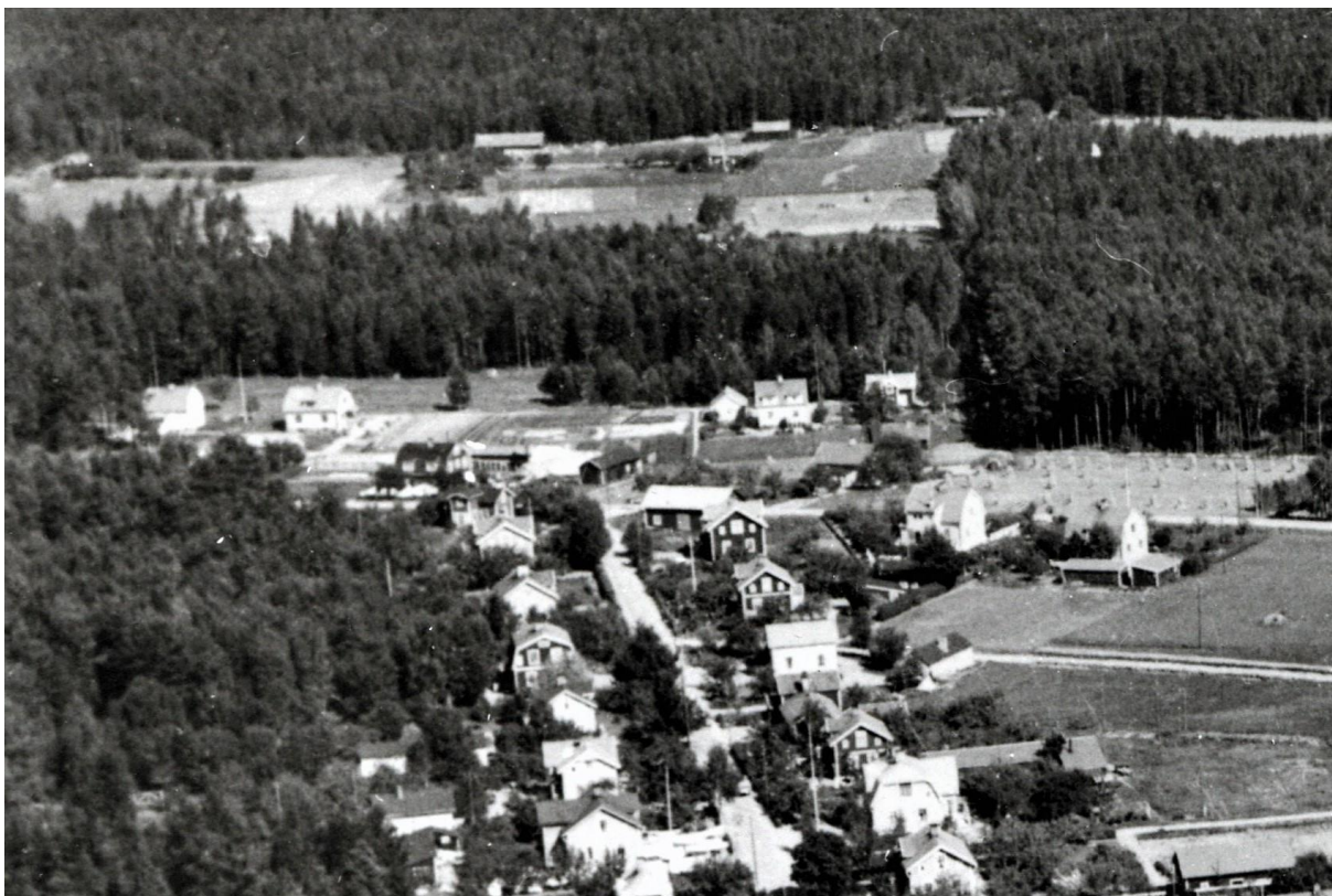
Mitt i bilden ser man korsningen Bärbovägen Nykyrkavägen. Till vänster i korsningen ligger idag macken. På fotot kan man ana huset Rosenhill. Flygfoto ca 1932.