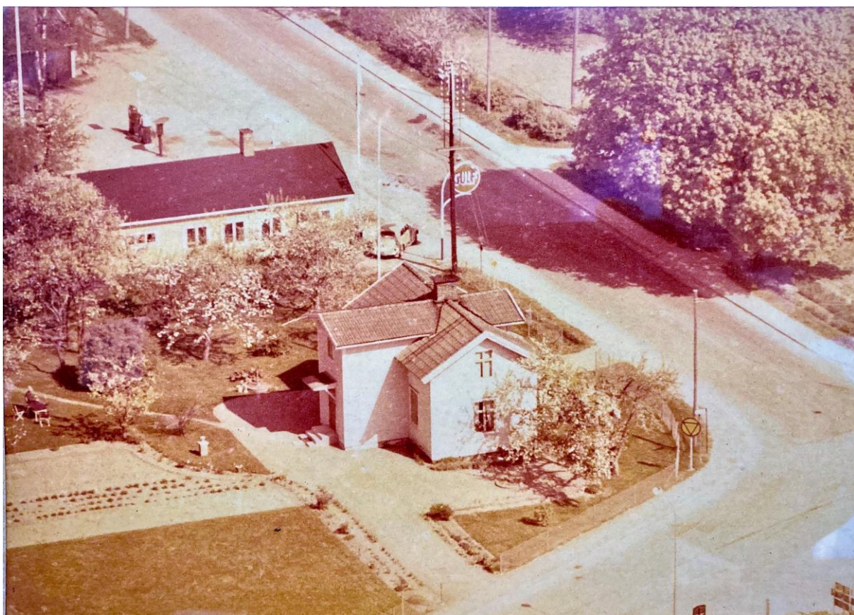
Rosenhill i förgrunden, man ser också cykelverkstaden och bensinpumparna. Det var vänstertrafik. Se stoppskylten! Flygfotot från 1960-talet är hämtat från "Din Lilla Mack".