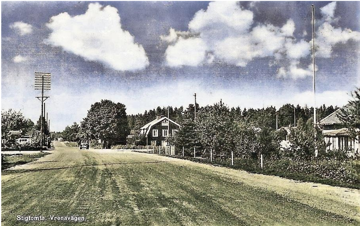
Nykyrkavägen på 1950 talet. Macken till vänster är lite skymd. Kolorerad.

Solvik finns kvar medan Rosenhill revs när den nya macken byggdes 1965. Kommentarer från Facebook på sista sidan.