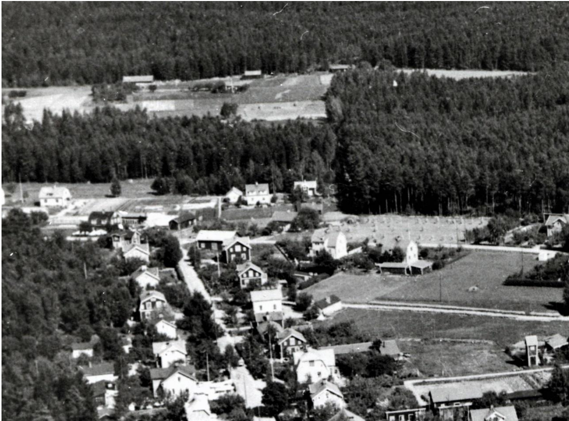
Bild från ca 1935 där man ser norra delen av "Berggrensgatan". Man ser också ladan som Curt Oskarsson berättar om

Ladan revs någon gång under 40-talets mitt.” –