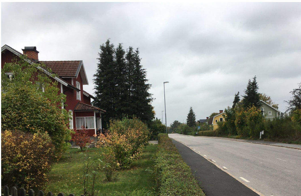
Bärbovägen 20 Dalby. T h Nr 17 Solhem och nr 15 Rosenfors.