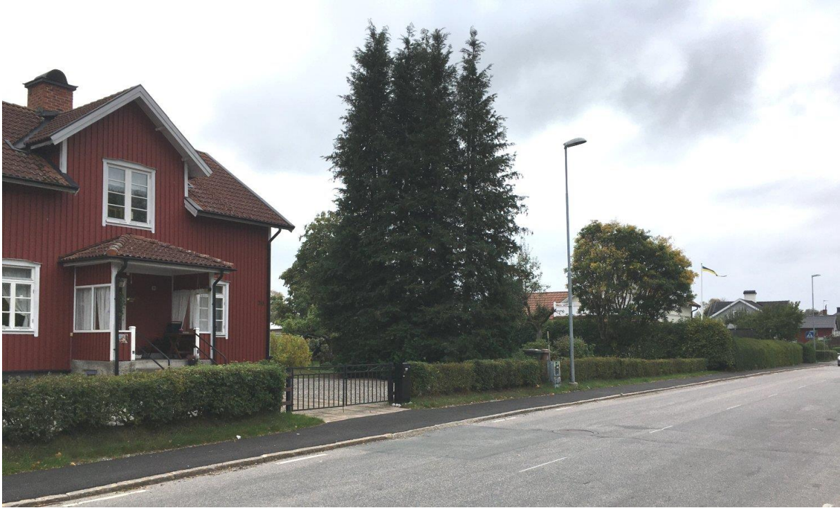
Bärbovägen 20 Dalby, foto 2020 Mikael Wingren.

Kommentarer från Facebook på sista sidan