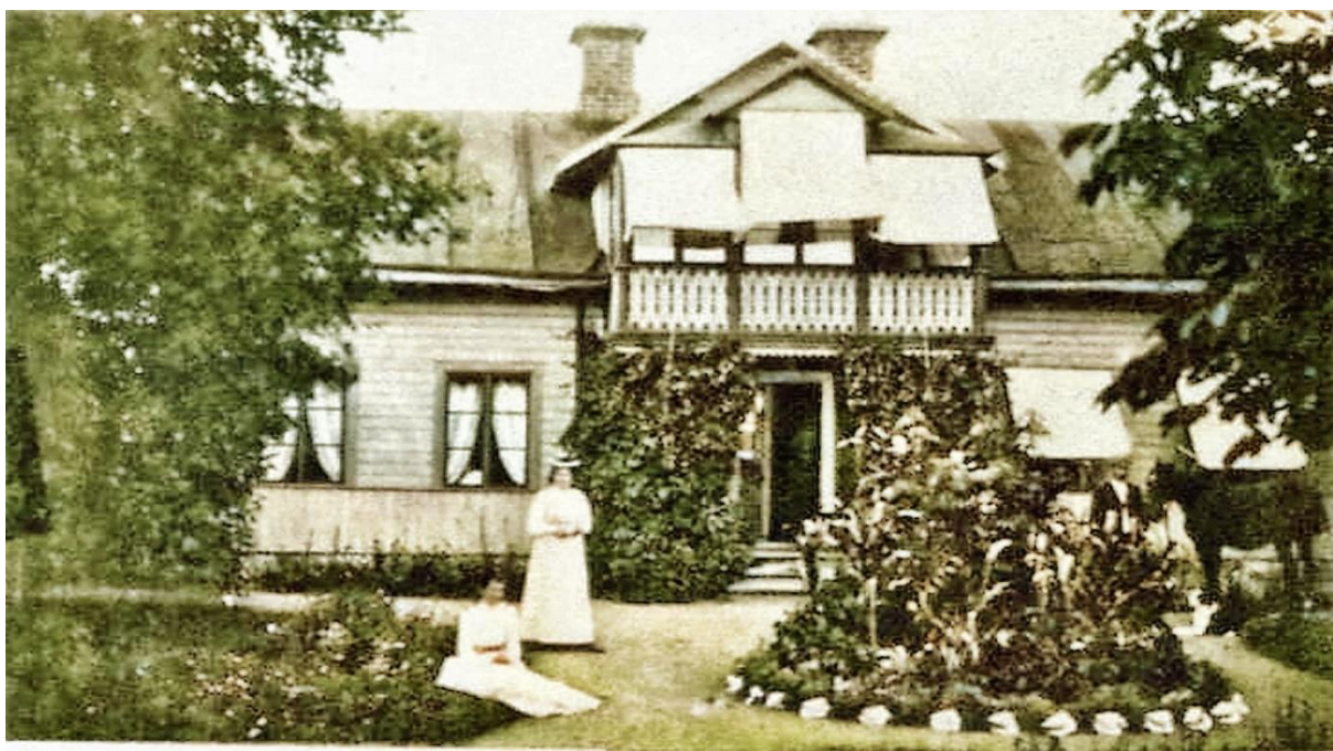
Stigtomta Telefonstation, (Södermanland)