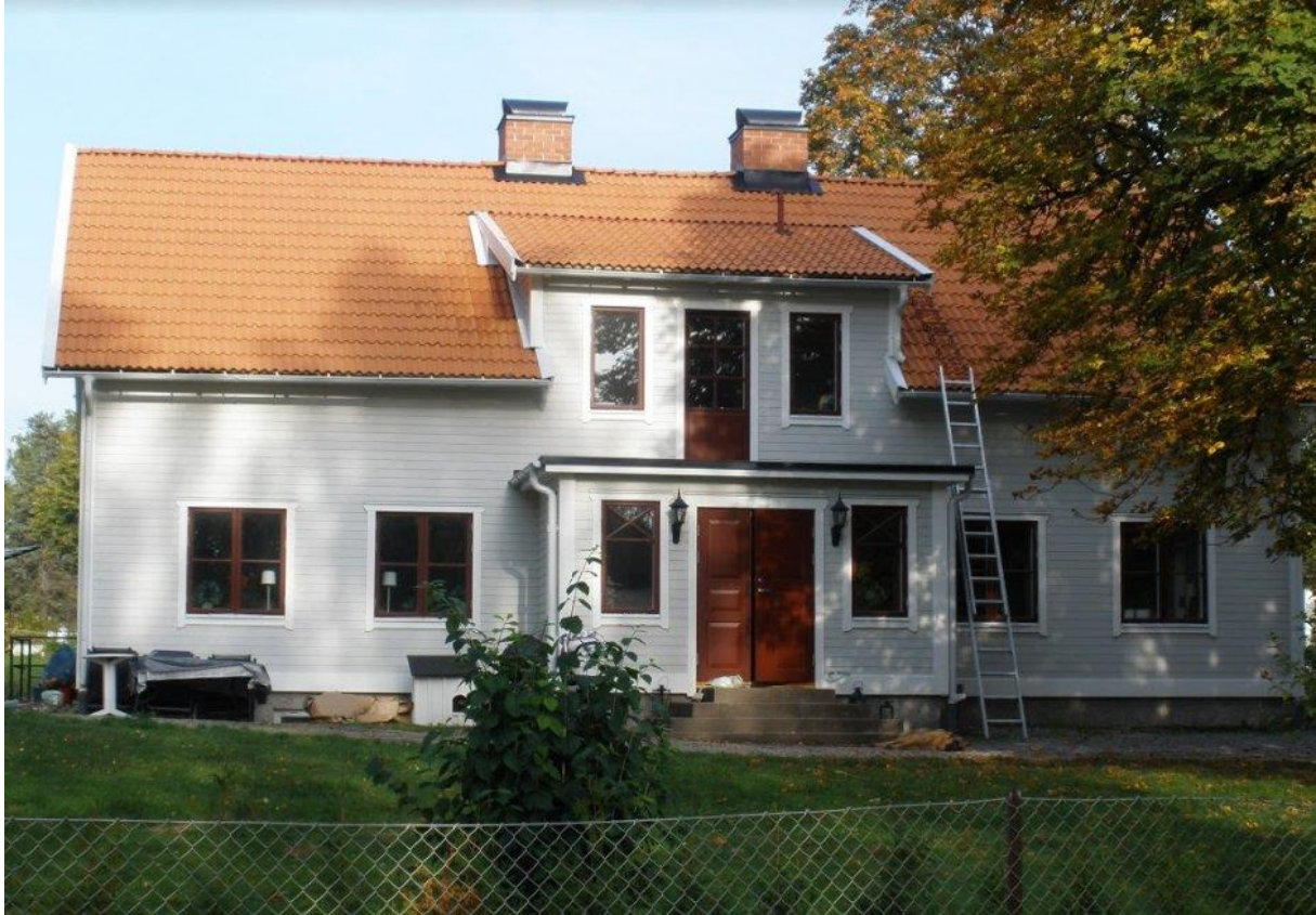
Uddbol 2017.

Taxirörelse bedrevs av H W Wihr från 1940-talet.