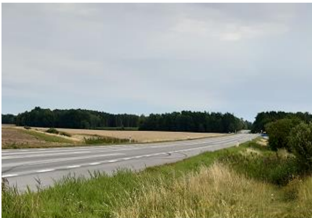
2020 i augusti