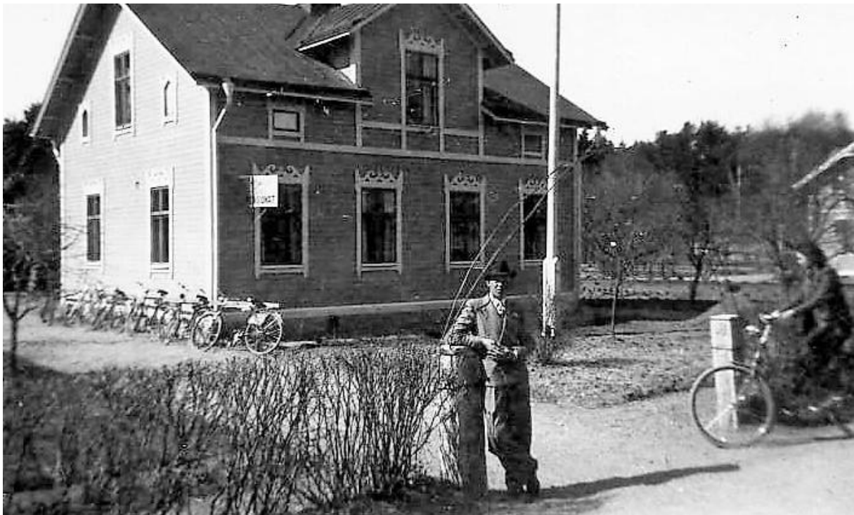
Palmlads Café kanske 1950-tal.