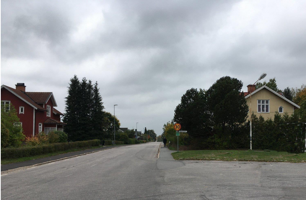
Till vänster Bärbovägen 20 Dalby, till höger nr 19 Duveholm, foto 2020 Mikael Wingren.

Byggår ca 1910 Fastighet: Tengsta 1:41 med namn Duveholm nr 1. Förste ägare Knut Arvid Andersson. Nuvarande ägare Robert Eriksson.