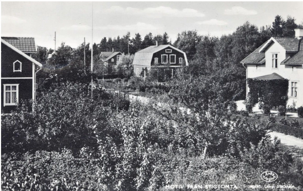
Vykort 1950? Till vänster Bärbovägen 18, sedan nr 13 Hagalund, nr 15 Rosenfors och till höger nr 17 Solhem.