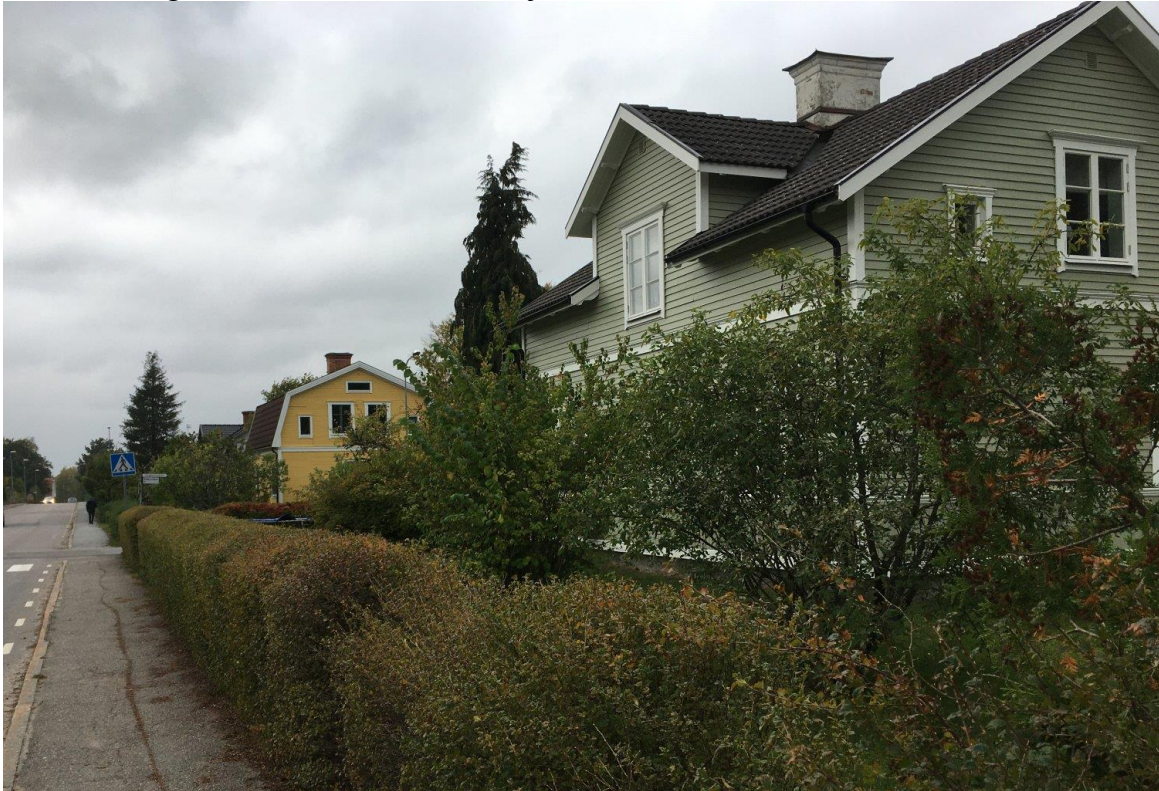
Bärbovägen 17 Solhem, foto 2020 Mikael Wingren.

Byggår ca 1912 Fastighet: Tengsta 1:17 med namn Solhem. Förste ägare Knut Andersson i Duveholm. Nuvarande ägare Thomas och Johanna Öjemark.