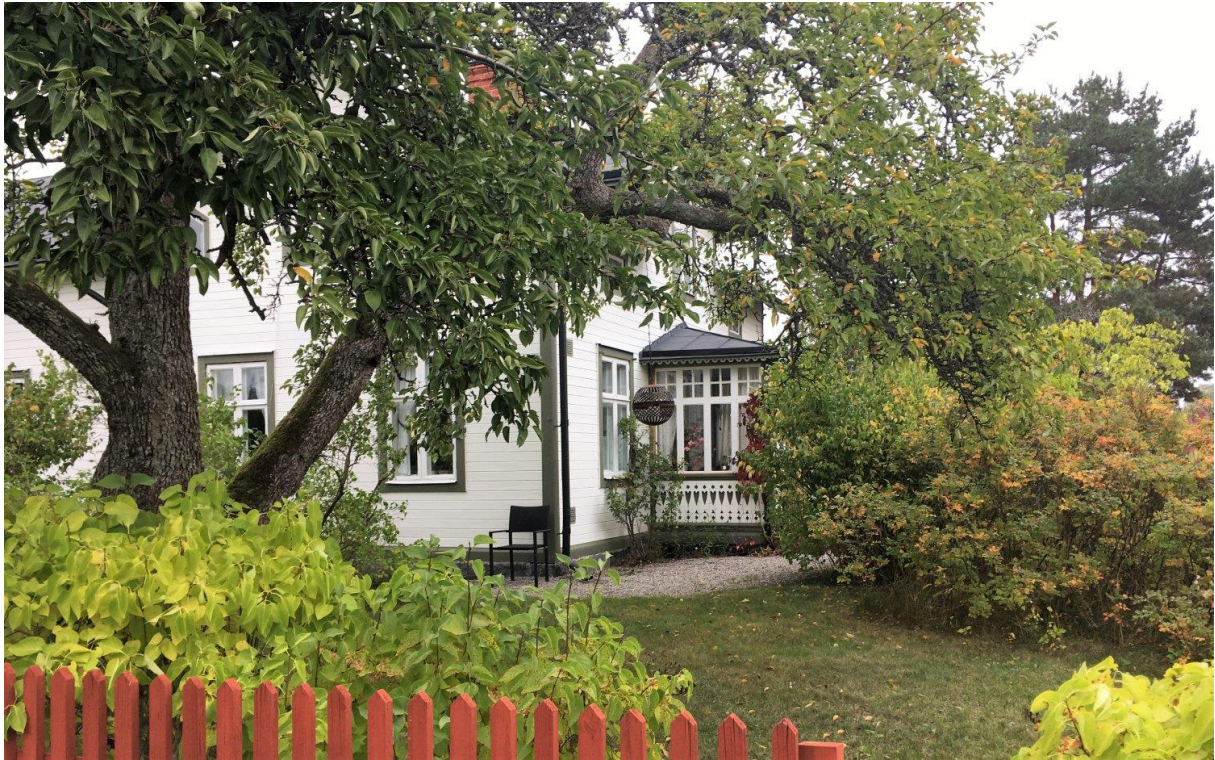
Skogsborg 2020