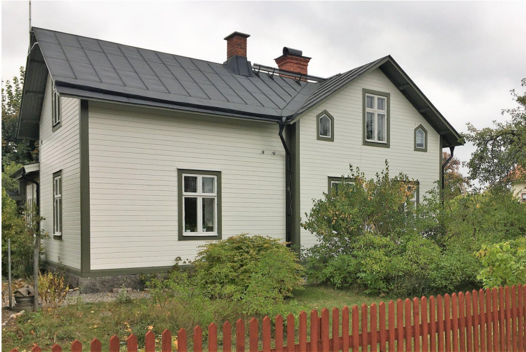
Skogsborg från Almnäsvägen 2020