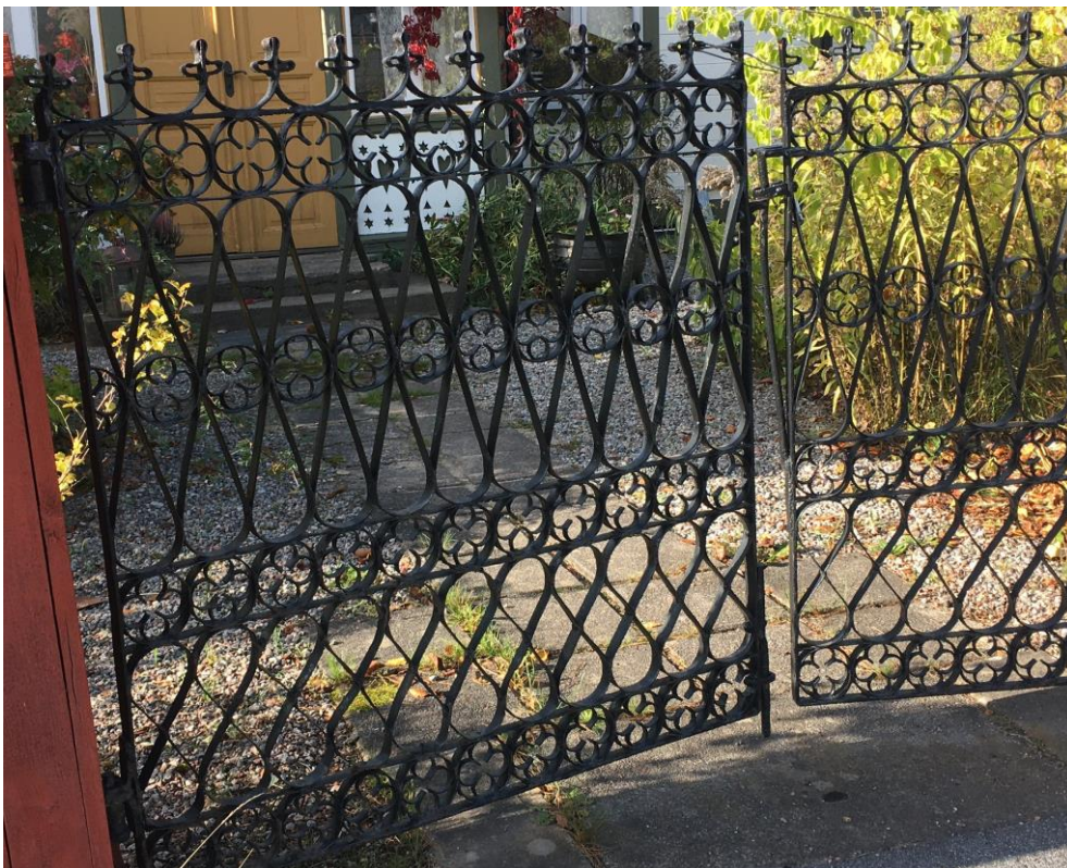
Grindarna är tillverkade av smeden Uhrbom