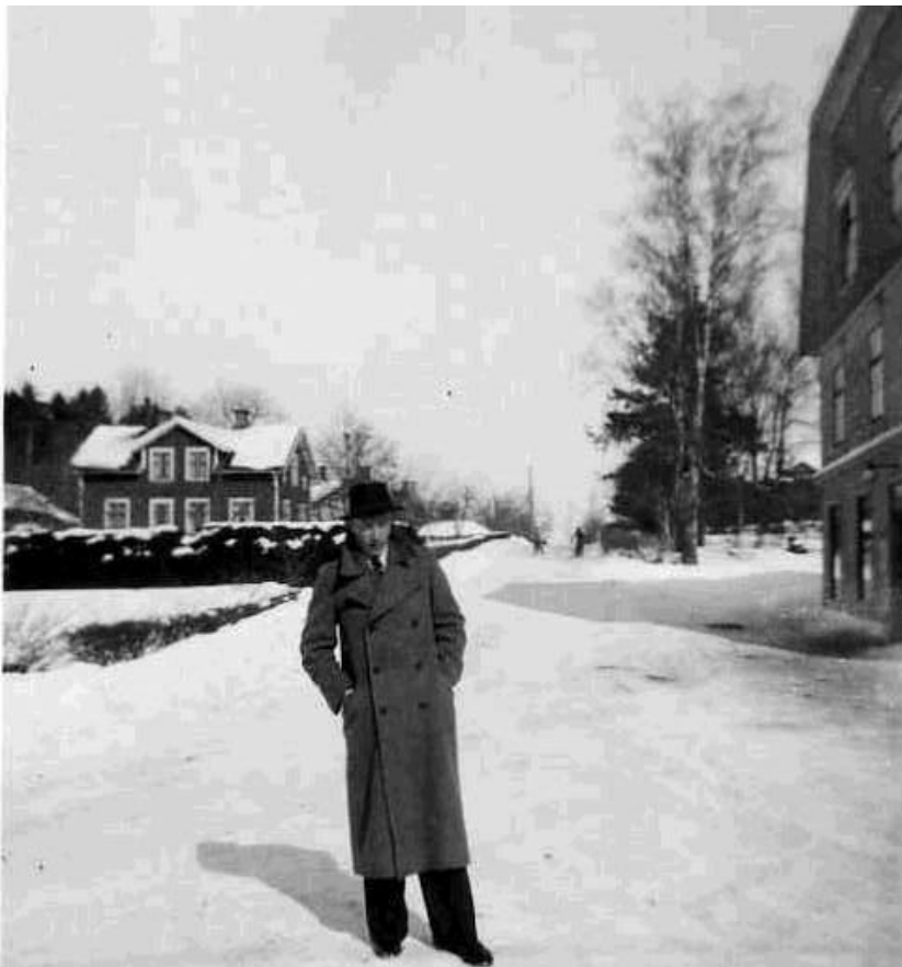
Vinterbild troligen 1950-tal. Berggrens, Bärbovägen 2 till höger och i bakgrunden nr 3 Björklunda. Mannen är okänd.

Byggnadsår troligen 1904-1905. Tomten finns med i karta från 1890 och dokument daterat 1903 se sista sidorna.