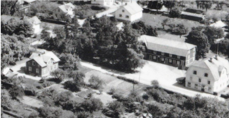
Del av flygfoto 1958. Björklunda till vänster

Byggnadsår troligen 1904-1905. Tomten finns med i karta från 1890 och dokument daterat 1903 se sista sidorna.