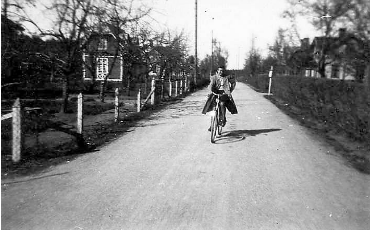
Från vänster, Bernsborg nr 7 och bakom skymtar nr 9 Lundby, Palmblads Café. Till höger nr 8 Haga. 1930-tal