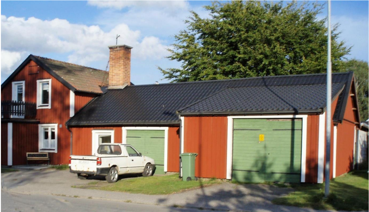
Berggrensgatan, Bärbovägen 14, vandring 2007.