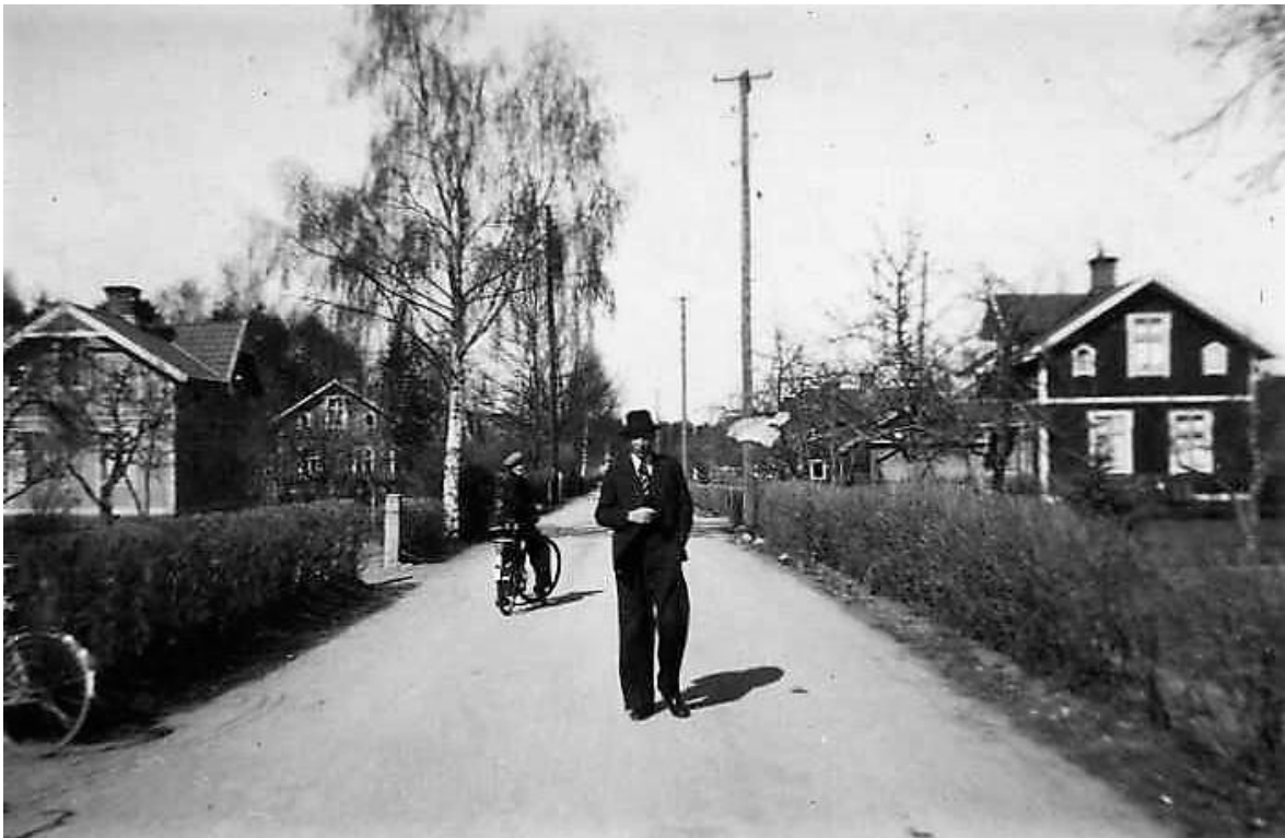
Rosenberg 1, Bärbovägen 12 Roos Cykel till höger. Där bakom skymtar Rosenberg 2. Foto ca 1950.