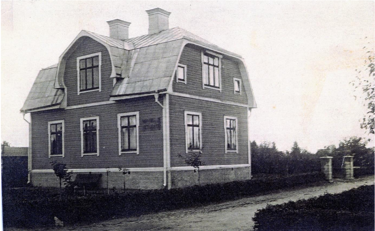
Lövsund kanske 1930-tal.