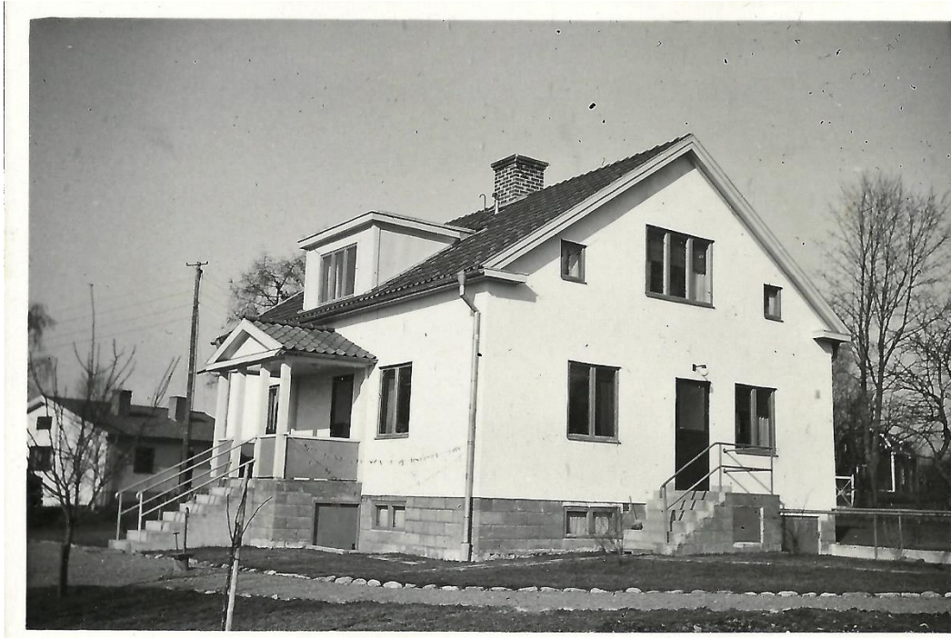
Majgården nybyggd 1939