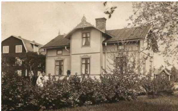
Tomtebodå med Kvarnen till vänster och Oskarsberg till höger, 1920-30-tal