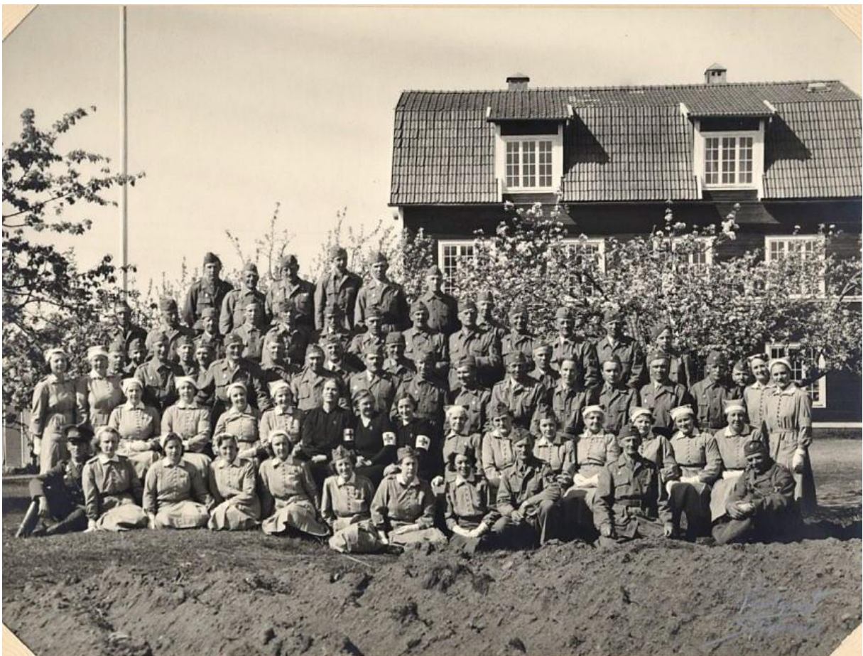
Lottor och hemvärnsmän vid Kvarnen 1945, notera potatisodlingen framför.