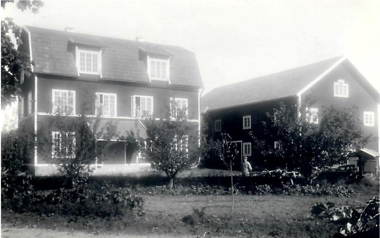
Kvarnen ca 1930