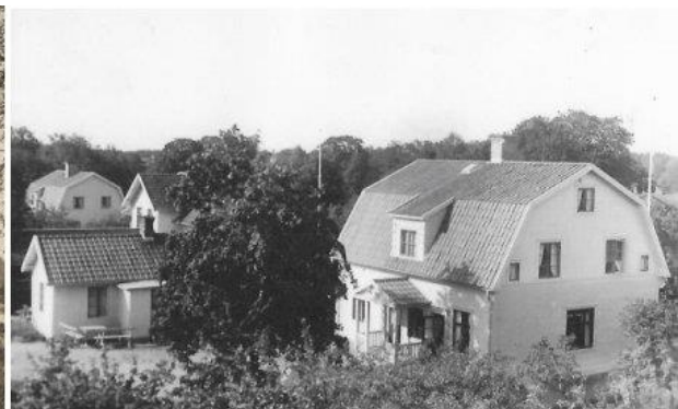
Tomtebodå efter ombyggnad