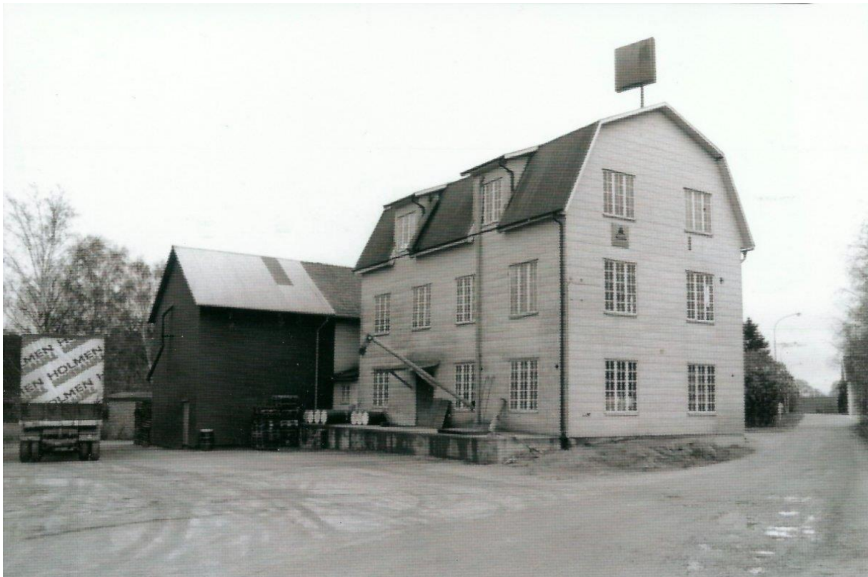
Kvarnen efter 1975.