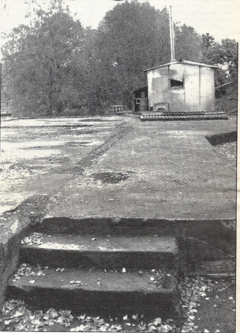
Uppför den här trappen har det burits mycket under årens lopp.