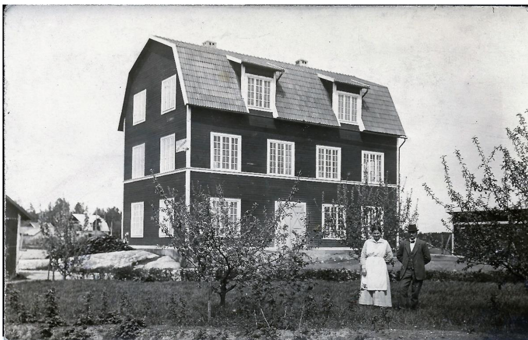
Kvarnbyggnaden fotograferad ca 1925