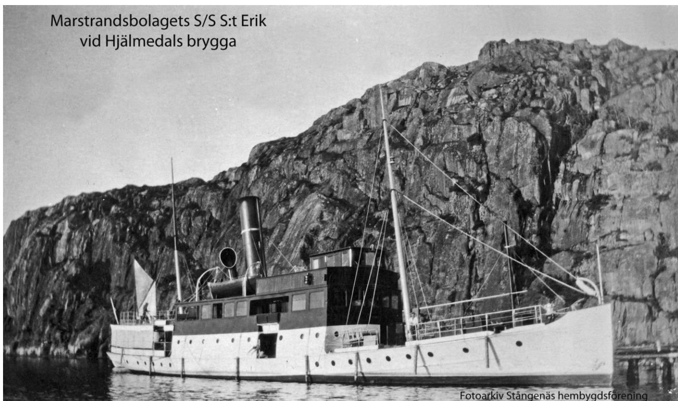
Marstrandsbolagets S/S S:t Erik vid Hjalmedals brygga

Samma bryggor kom väl till pass för de rederier som ombesörjde passagerare och godstrafik. Situationen var den samma som för stenlastningen, inga andra effektiva transportmedel stod till buds.