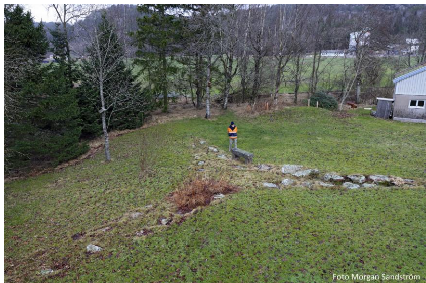
Långben Reses grav Bjälkebräcka 2022, Sven Olof Bjelkert