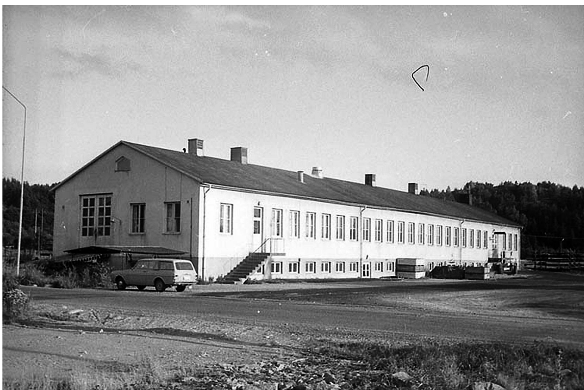
UMFA53318_0414 Brodalen Mekaniska verkstad 1980

Det verkliga uppsvinget kom i slutet av 1950-talet.