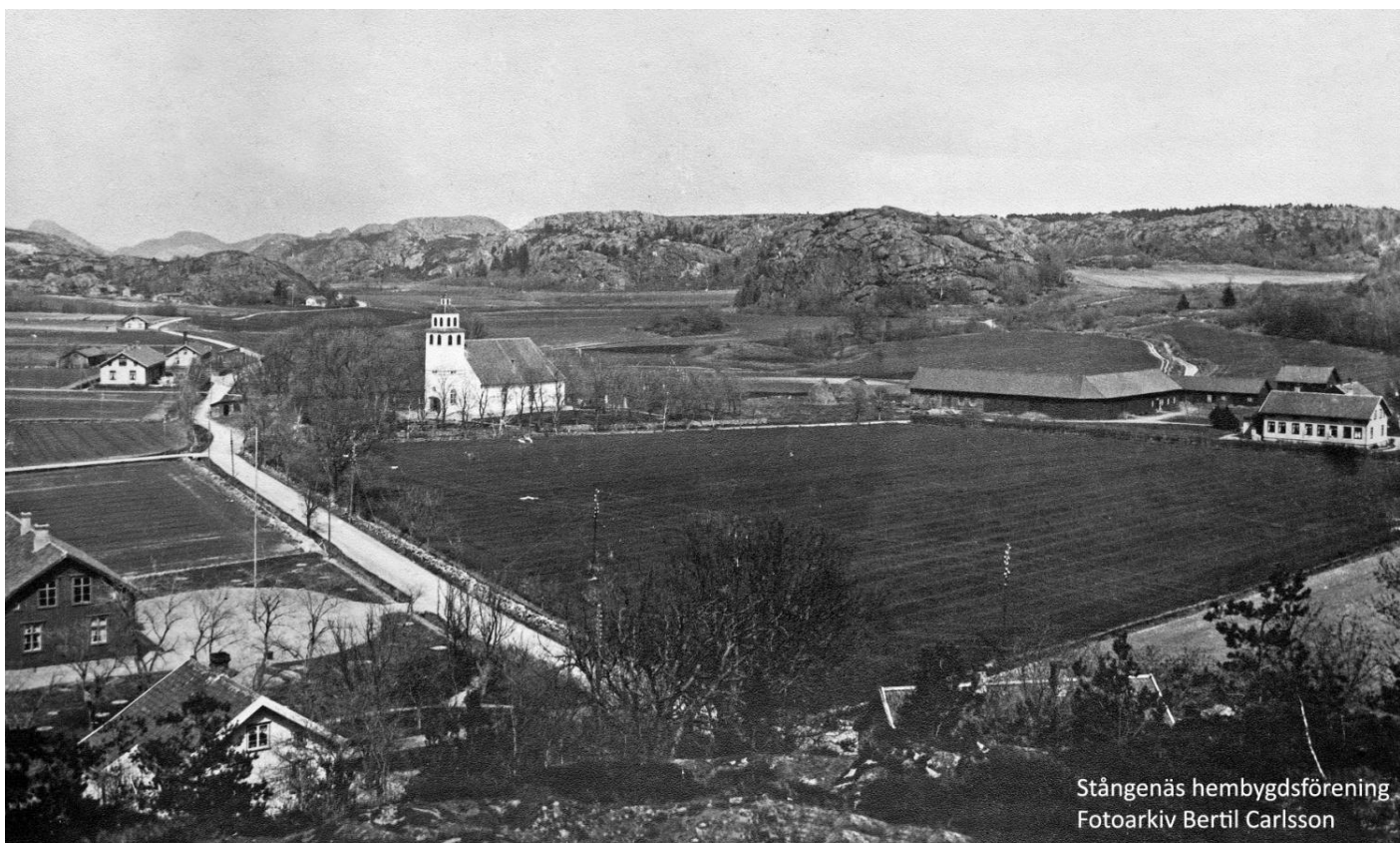
Bro ca 1900