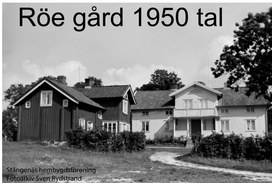
Röe gård i Bro socken. Det gamla huset till vänster är från 1700 talet och där hölls förr småskola