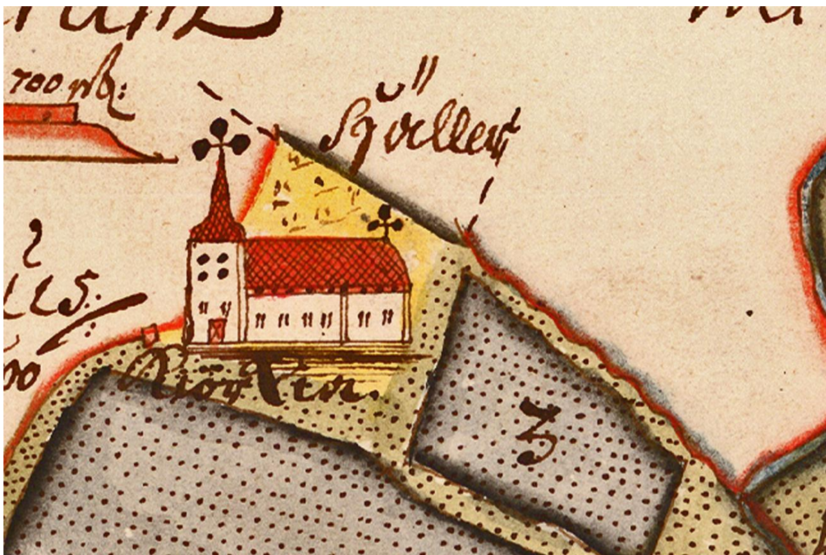
Bro kyrka 1698