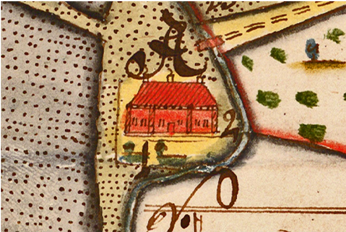
Bro prästgård 1698