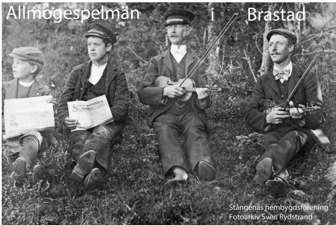
Allmogespelmän i Brastad vid seklets början.