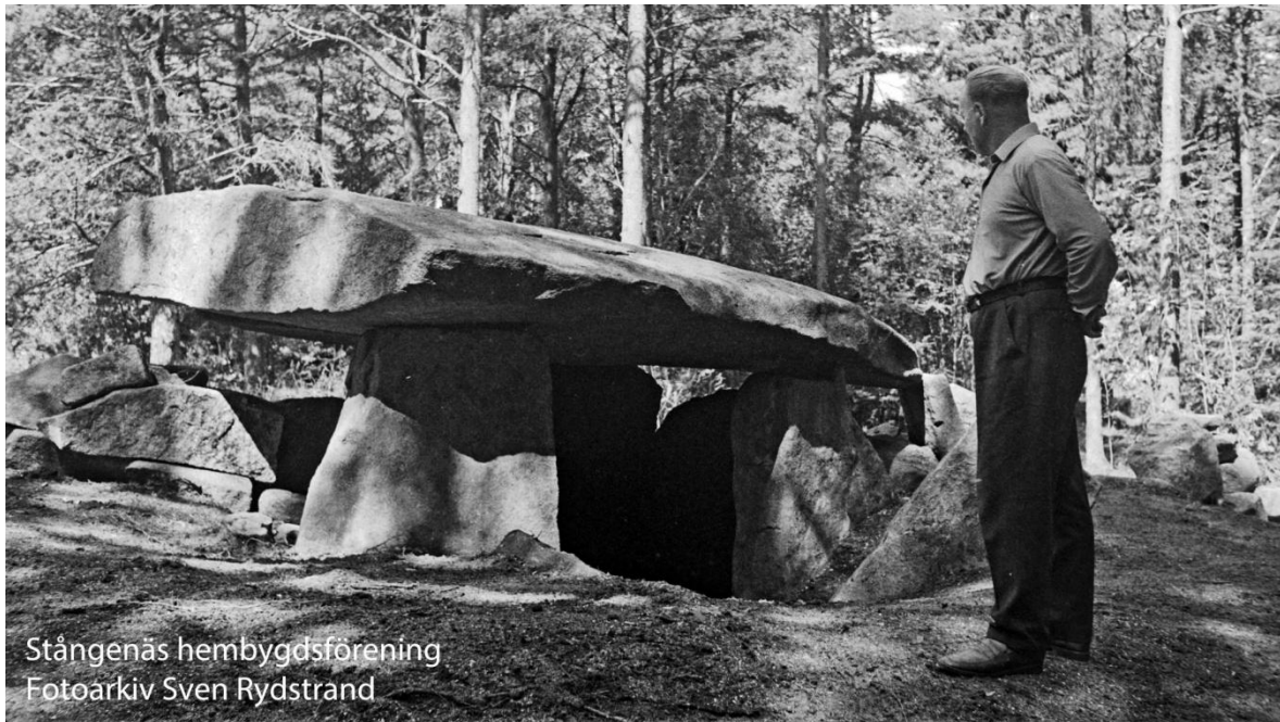
Stångenäs hembygdsförening