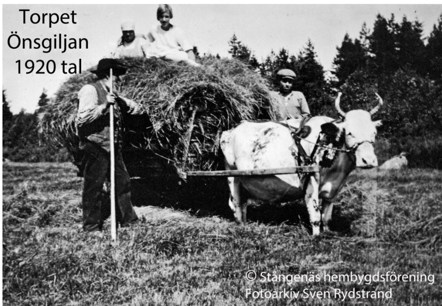
Torpet Önsgiljan 1920 tal

DET ÄR ETT MÄKTIGT FJÄLL, Skottefjället, detta skogklädda massiv, som man skönjer de yttre konturerna av i väster, då man från Dingle samhälle vid Bohusbanan åker över Gläborg och Hallinden ut över Stångenäset. Reser man från samma utgångspunkt genom den vackra Berfendalen till Sotenäset, ser man fjället från öster med ofta lodräta, höga väggar stiga upp ur den gamla fjordbotten. Det imponerar, både genom sin storlek och sin skönhet. Omkring en halv mil i fyrkant når det och det är därtill ganska högt efter bohusslänska förhållanden räknat. Här reser sig nämligen de kringliggande häradernas allra högsta bergsklack, Kobu kulle, som höjer sig 166 meter över havet, närmast följd av den sydligaste Grövsullen, som når 151 meter, och Hallinds kulle, som ehuru mest framträdande, dock inte är högre än snött 143 meter. Dessutom finns det också här och där på fjället flera andra bergstoppar, som når upp till omkring 100 meters höjd. Fjällets skönhet förhöjes inte obetydligt av de många små bäckar, som ofta djärvt kastar sig utför bergsbranterna. Åtminstone ett par sådana forsar och fall bär det betecknande namnet "Migare-fossen".